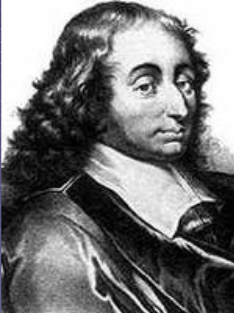
Блез Паскаль (1623 – 1662)