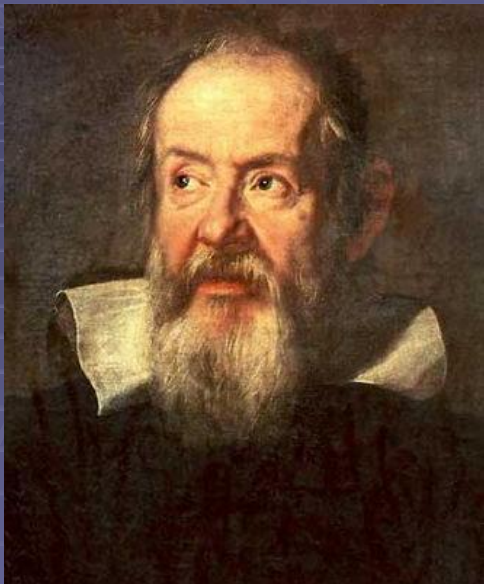
Галилео Галилей (1564 – 1642)