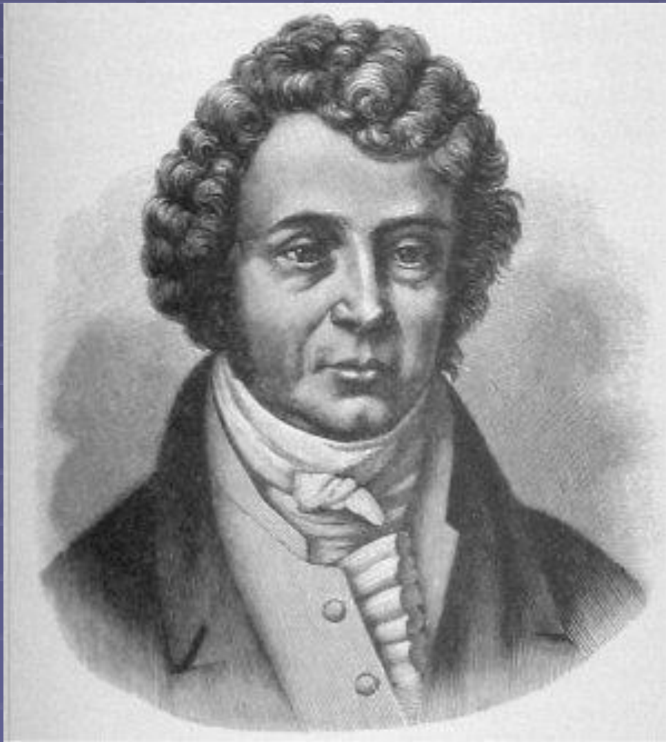
Андре Мари Ампер (1775 - 1836)