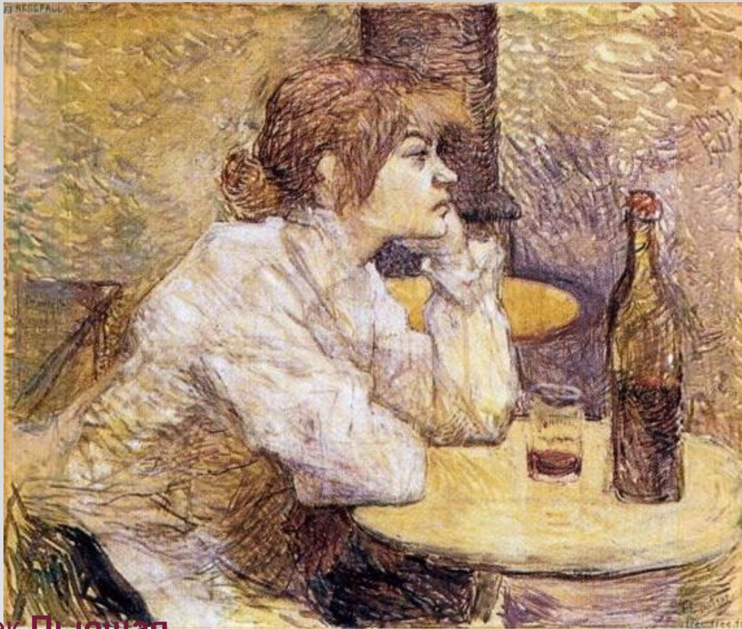
А. Тулуз-Лотрек Пьющая

Прочитайте начало рассказа. Как характеризуется героиня?