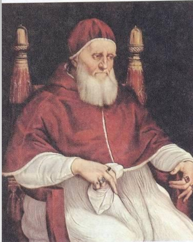
Рафаэль. Папа Юлий II. 1512.