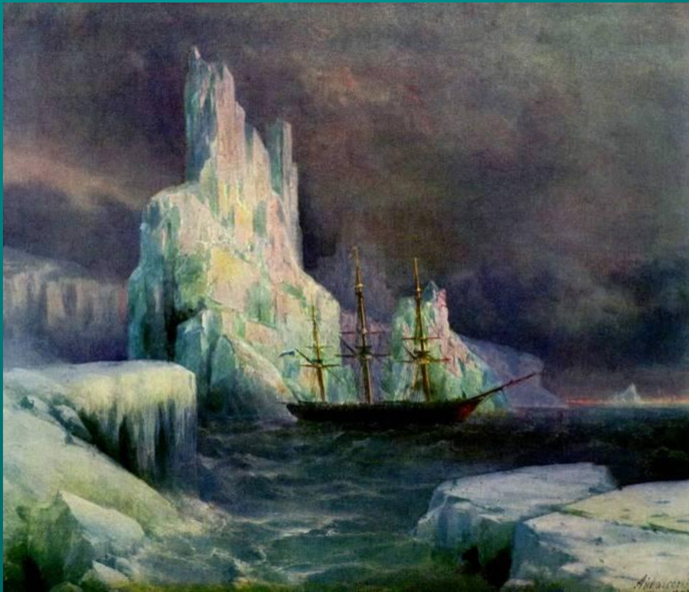
Ледяные горы 1870

Кроме изображения воды , художник прекрасно изображал снег и лёд .