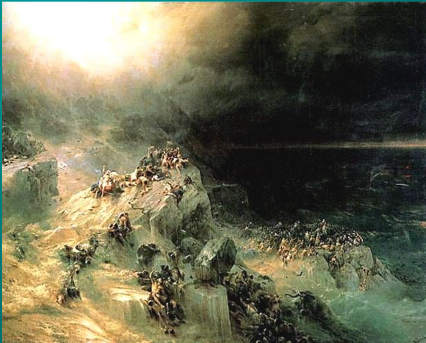
Всемирный потоп 1864

Иногда художник обращался к библейским сюжетам