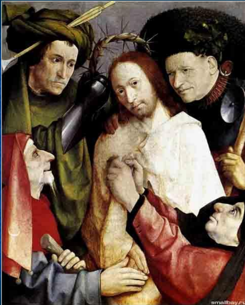
Увенчание терновым венком. 1490е – 1500е.