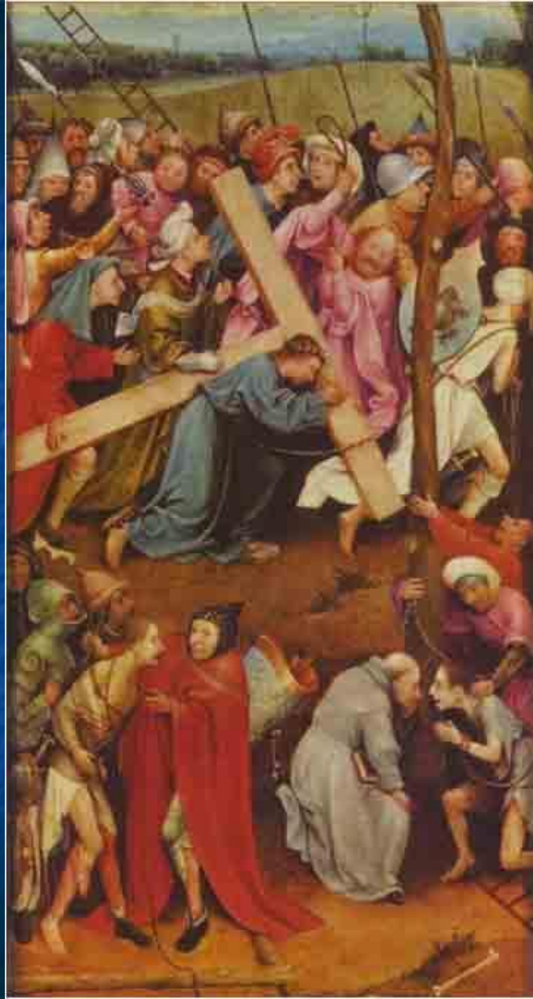
Несение креста. 1515-1516.