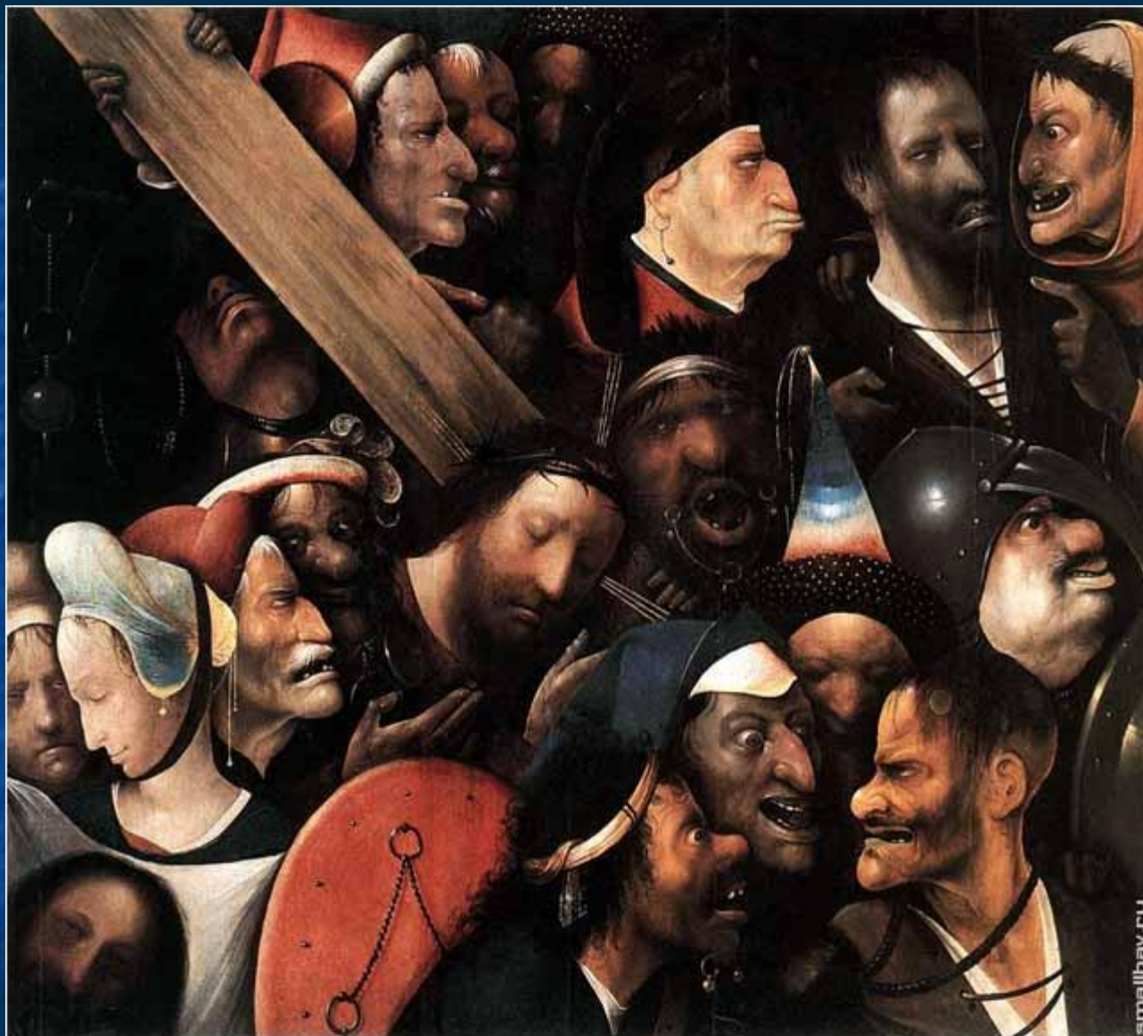
Несение креста. 1516.