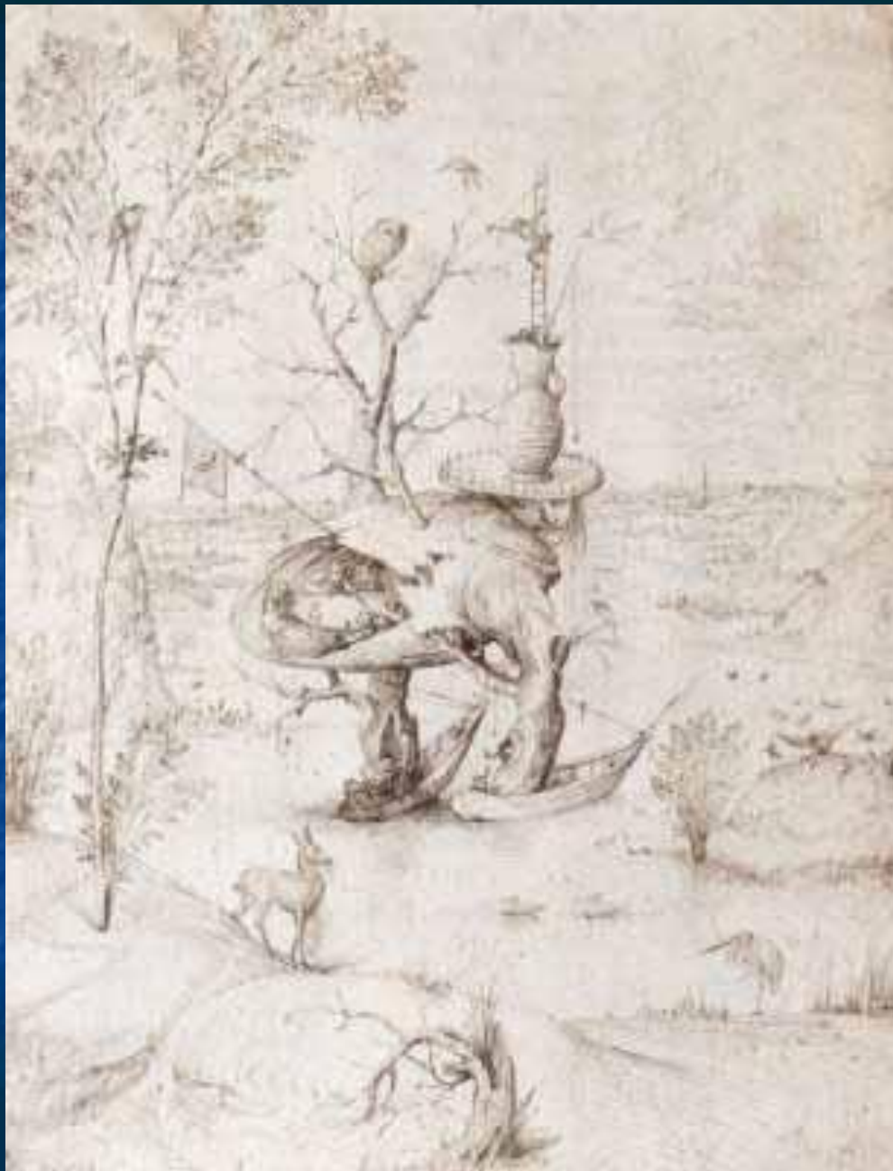
Человек-дерево в пейзаже