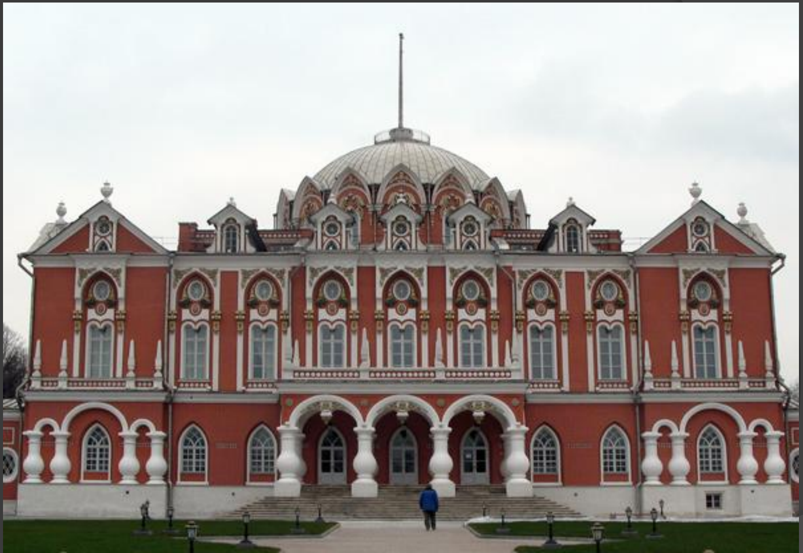
Петровский дворец. 1775 – 1782 гг. Москва.