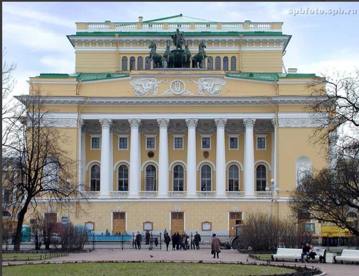
Александринский театр. Санкт-Петербург. 1832 г.