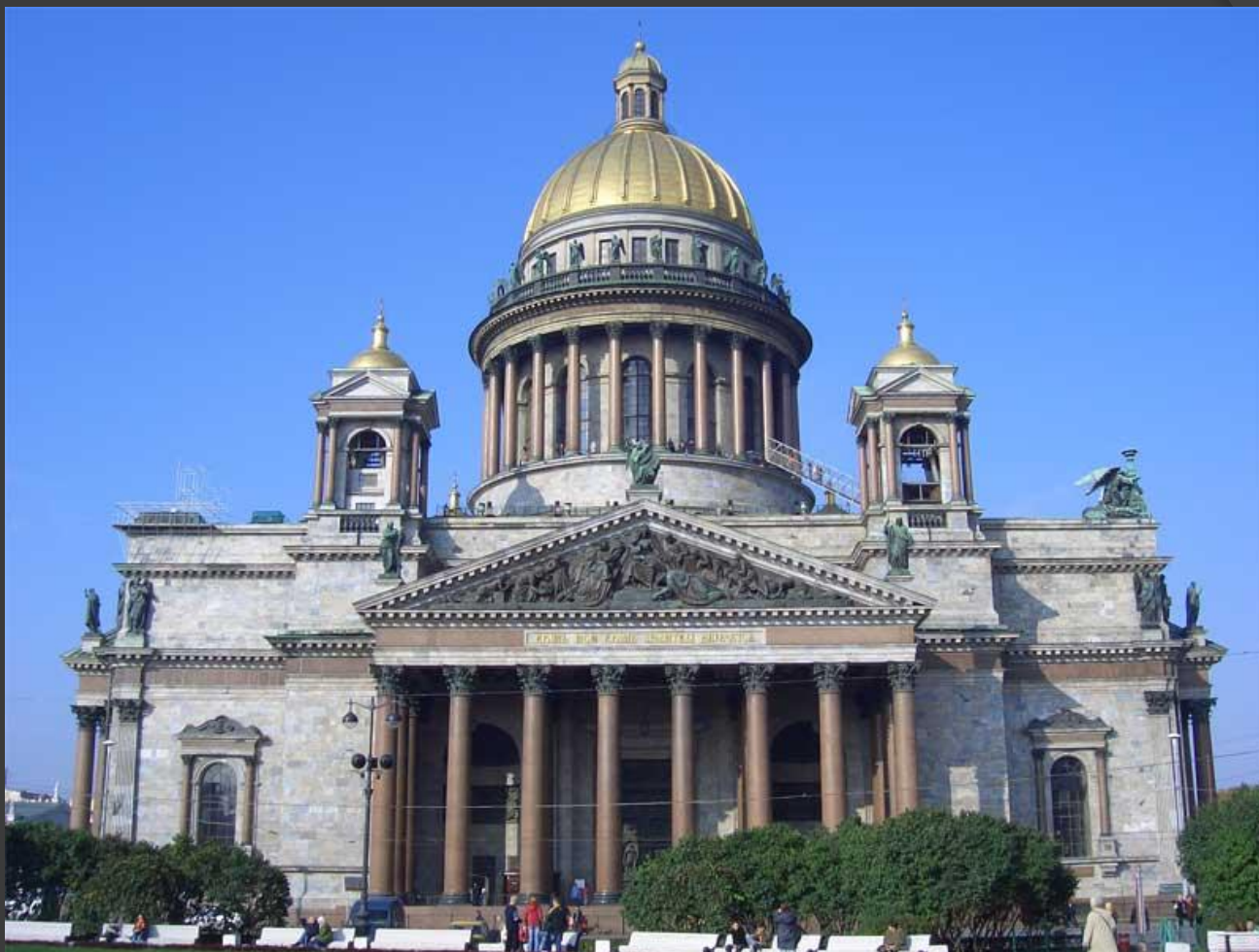
Исаакиевский собор. Санкт-Петербург. 1818-1858гг.