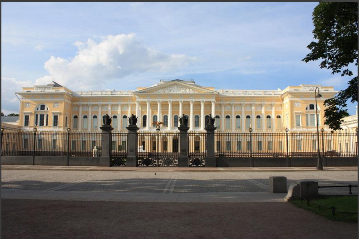
Михайловский Дворец. Санкт-Петербург. 1817-1825гг. Сейчас- Русский музей