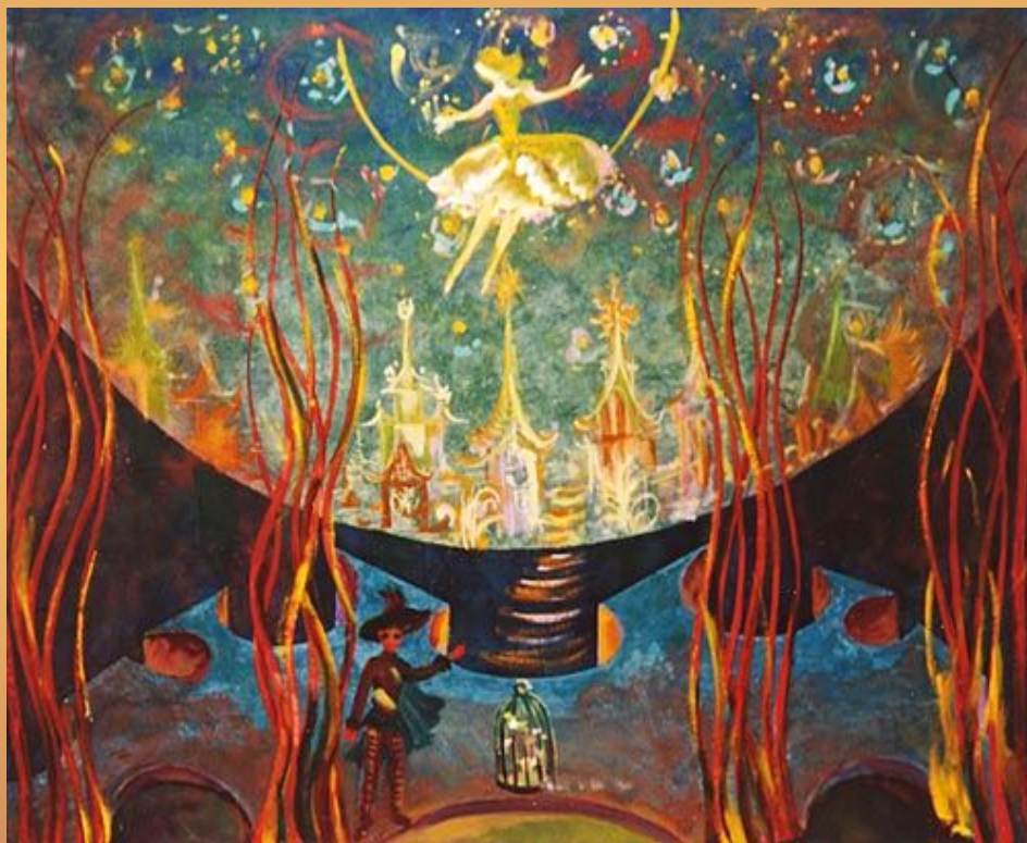
Эскиз декораций к опере «Волшебная флейта»