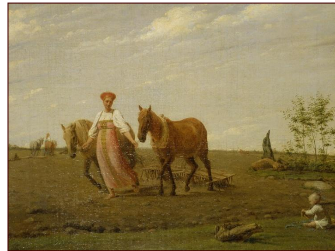
А Венецианов. Весна. На пашне. 1827г.