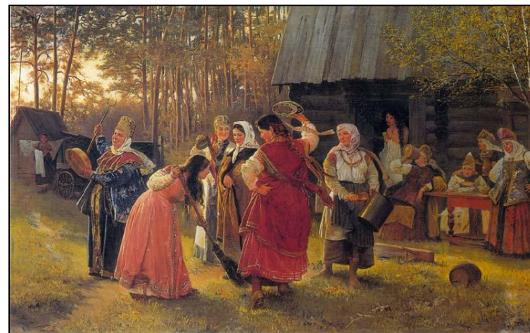
А.Корзухин Девичник. 1889г.