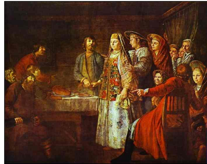
М. Шибанов. Брачный договор. 1777г.