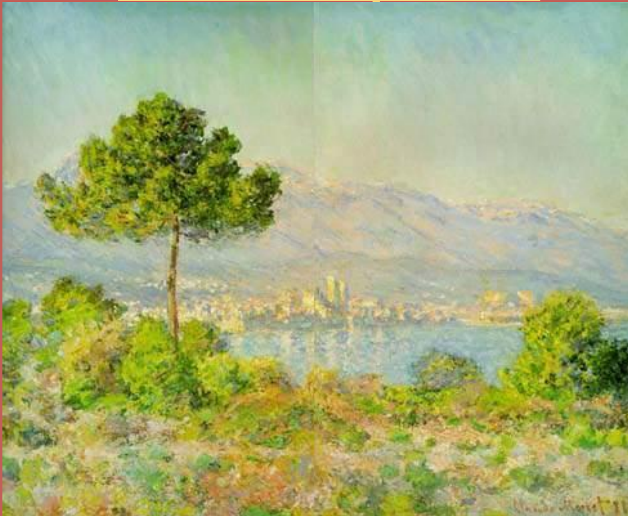
Пиния в Антибе 1888 год