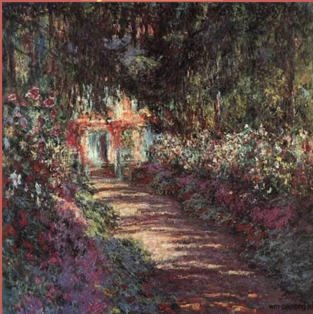
Сад в цвету 1901-1902