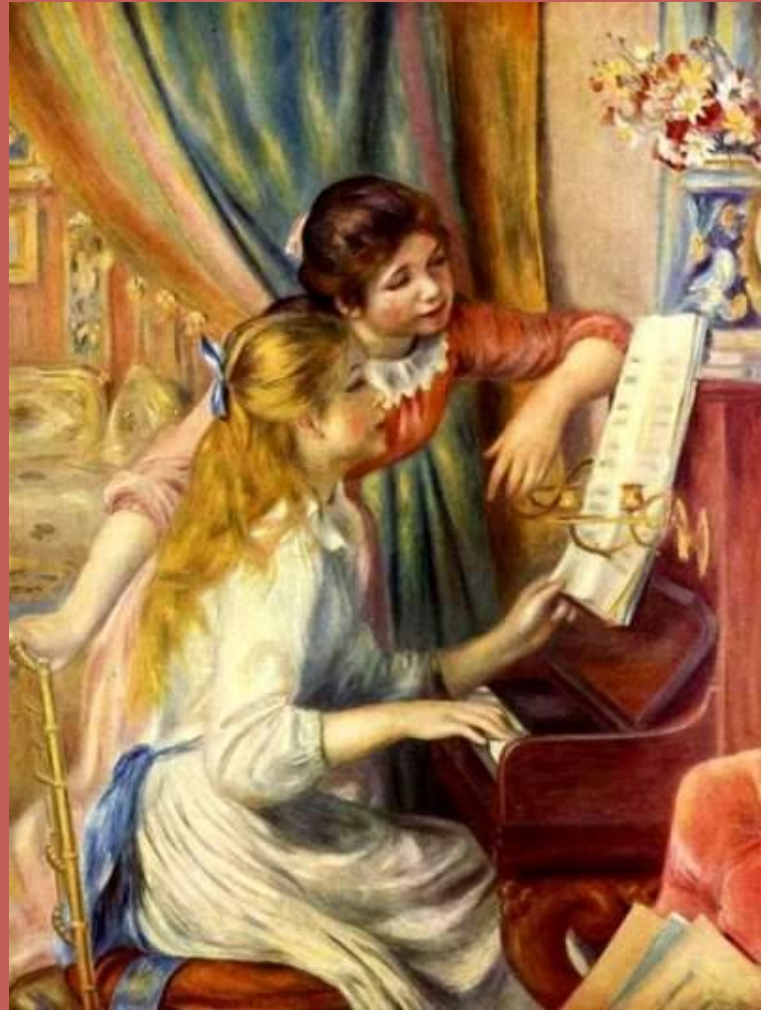
Ренуар (Девушки за фортепьяно)