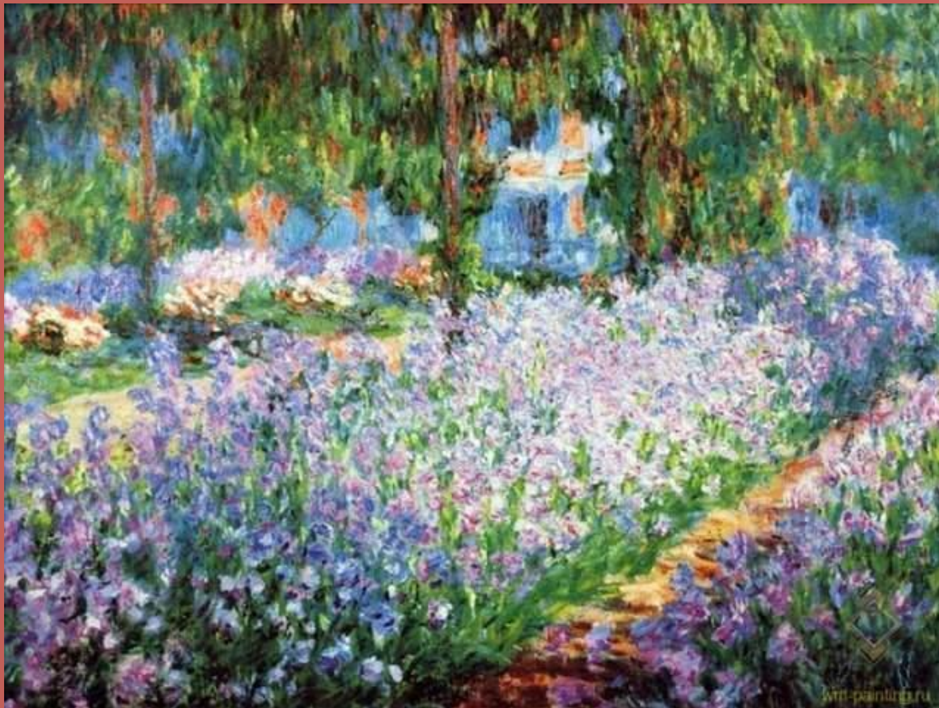
Клумба с ирисами в саду 1900 год