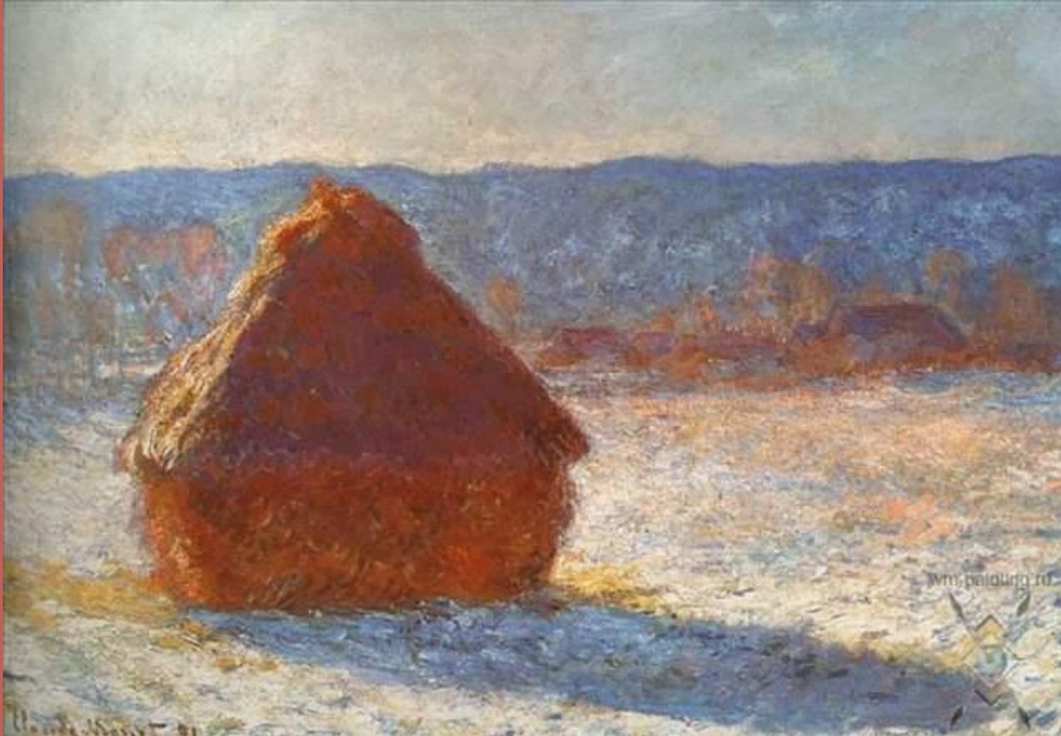
Стога сена. Эффект снега. 1891 года