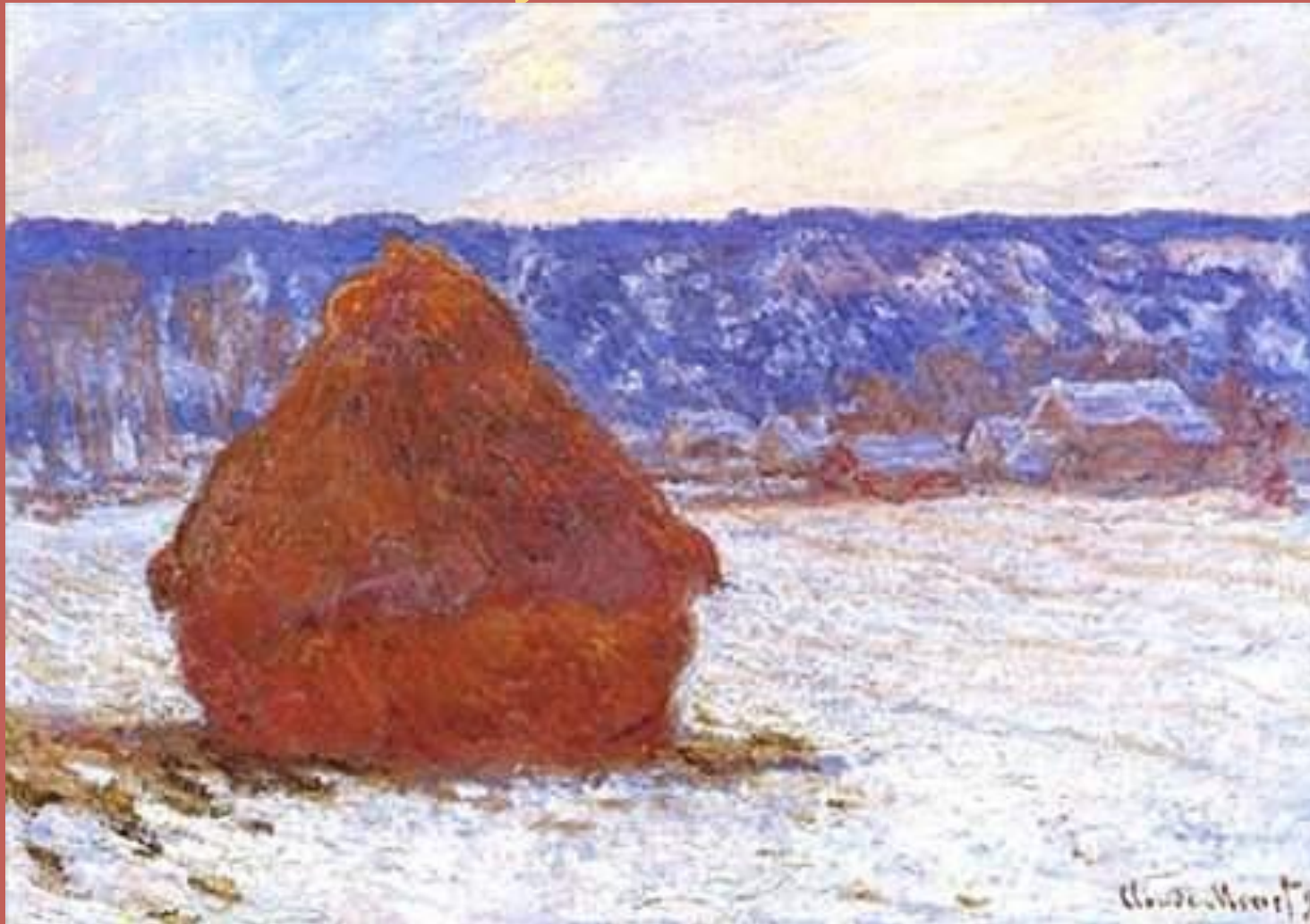
Стога сена. Иней.