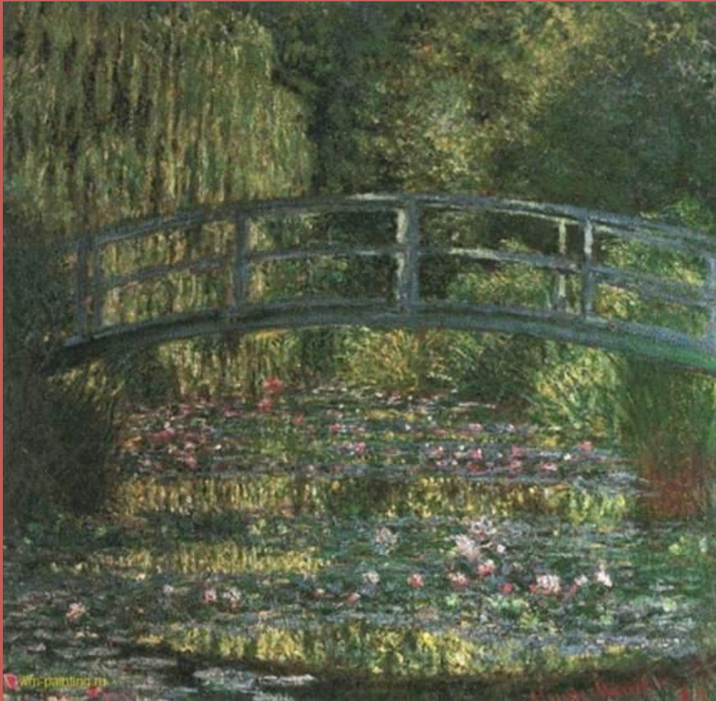
Пруд с водяными лилиями (зелёная гармония)