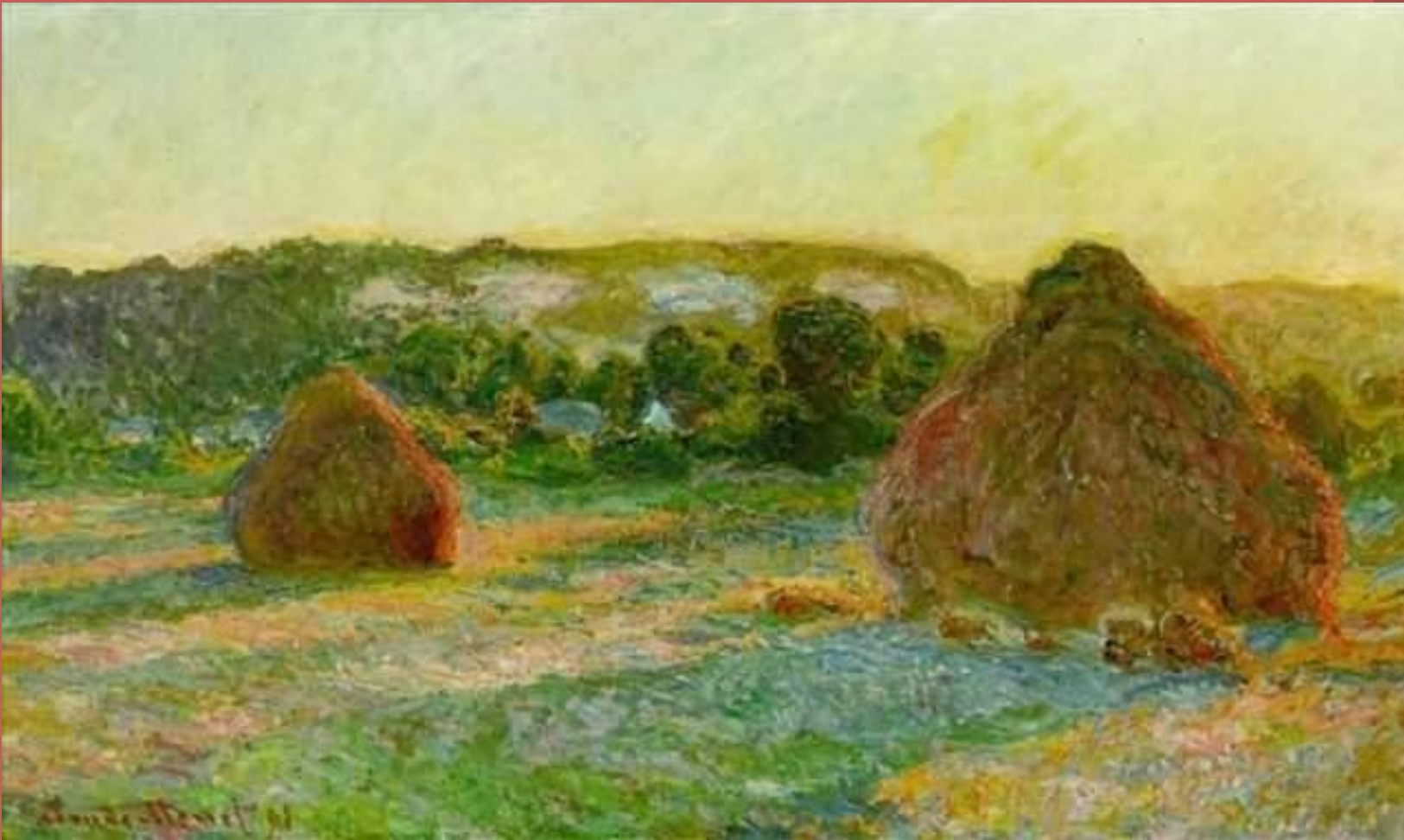
Стога сена. Конец лета 1890 года