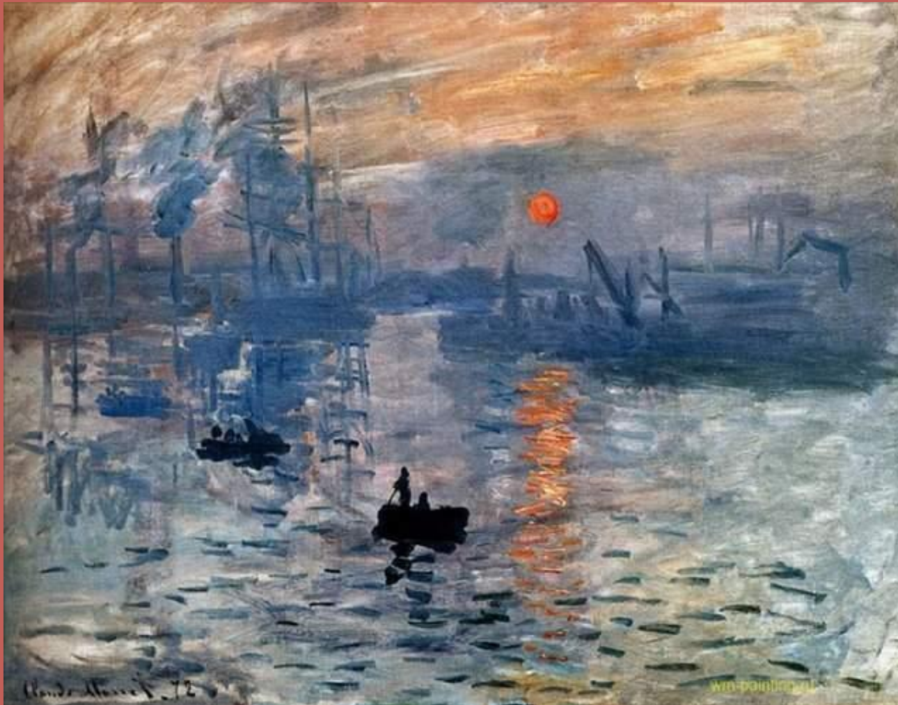
Впечатление. Восход солнца.