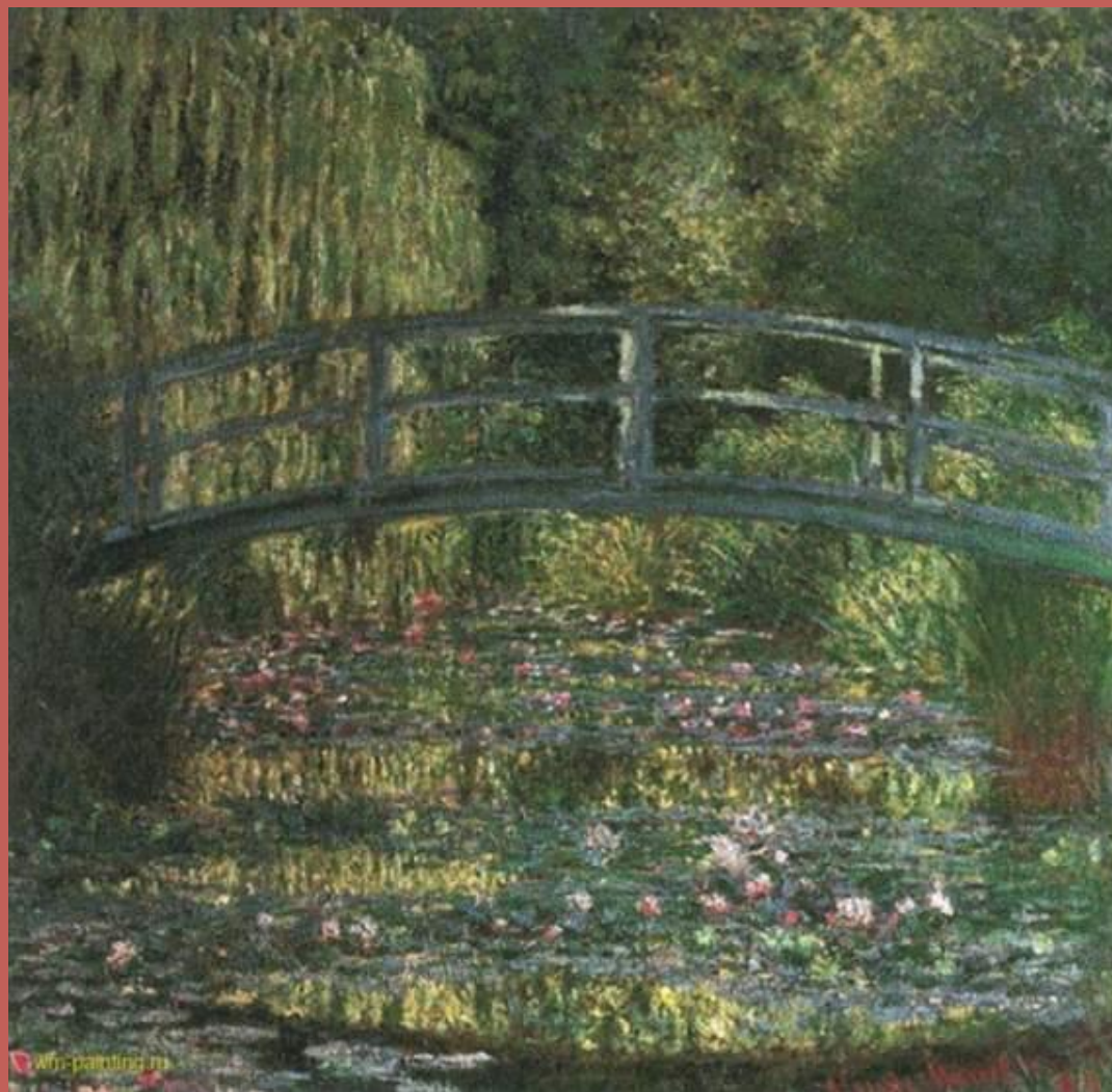
Пруд с водяными лилиями (зелёная гармония)