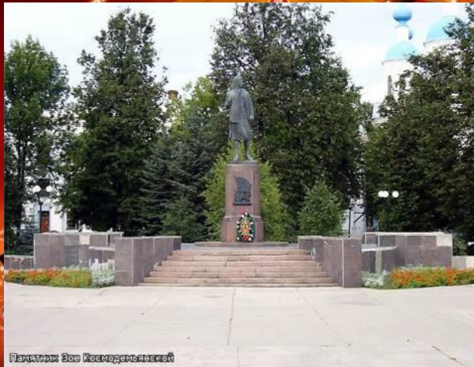
Памятник Зое Космодемьянской в г. Тамбове