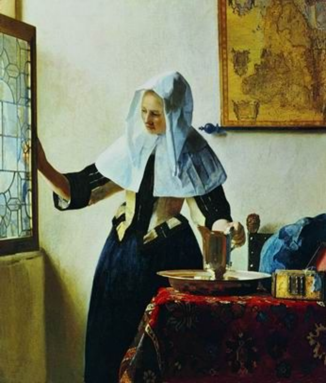
Молодая женщина с кувшином. Ок. 1664—1665

Начиная с 1660-х годов темы и образные идеи Вермера расширяются; появляются новые черты в характеристике персонажей, то более светских, то обыденных. В колорите утверждается редкая по красоте цветовая гамма, построенная на оттенках сине-голубого и желтого и объединенная общей серебристо-жемчужной тональностью; цвет теряет прозрачность, становится матовым, живопись — более ровной и гладкой. В излюбленном изображении одинокой женской фигуры в интерьере особое внимание уделяется колориту. Произведения этого времени более разнородны и художественно неравноценны. Среди них есть подлинные шедевры. Привычный для Вермера мотив «Молодой женщины с кувшином» (ок. 1664—1665, Нью-Йорк, Музей Метрополитен) покоряет своей свежестью. Художника восхищает изящество стройной женской фигуры, женственность жеста, с которым она отодвигает створку окна, и живой солнечный свет входит в комнату. В отличие