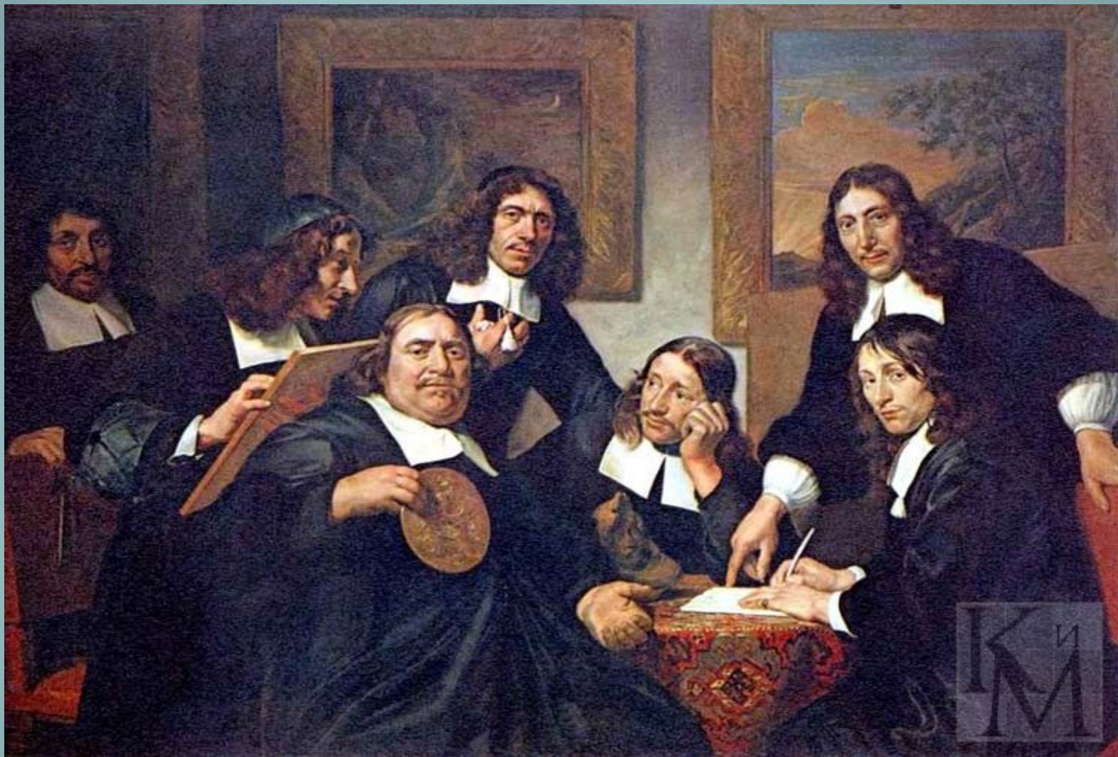
Ян де Брай. Старшины гильдии художников Харлема. 1675 год. Государственный музей в Амстердаме.