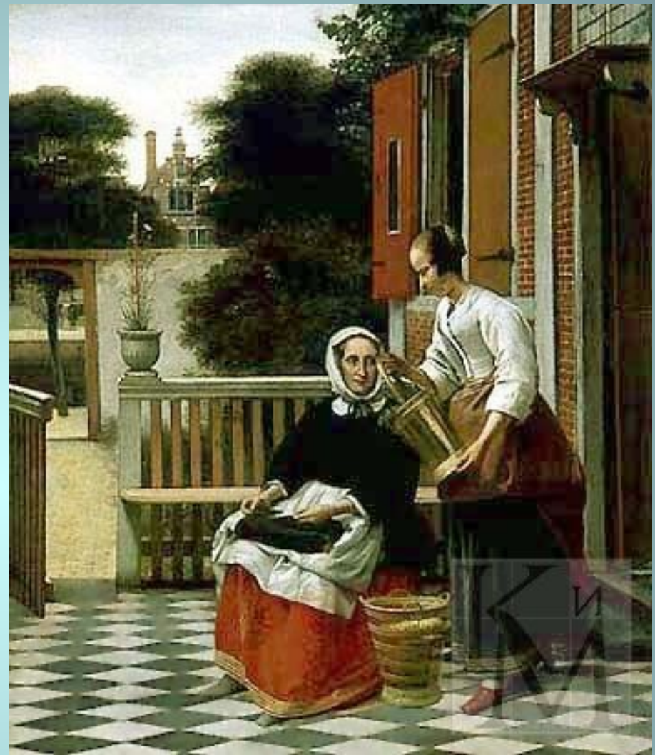
Питер де Хох. «Хозяйка и служанка» (около 1660, Эрмитаж). Голландские живописцы, в том числе и Питер де Хох, в своих картинах стремились воссоздать атмосферу скромного бюргерского быта.