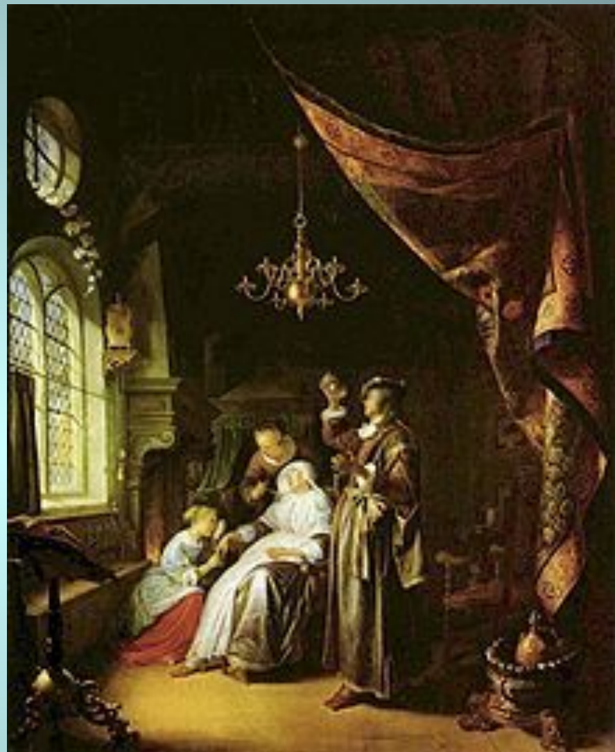
Доу, Больная водянкой, 1663 , Лувр