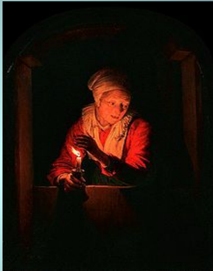
Доу, Старуха со свечой, Кёльн

Герард ДОУ — нидерландский художник, принадлежит к кругу «малых голландцев».