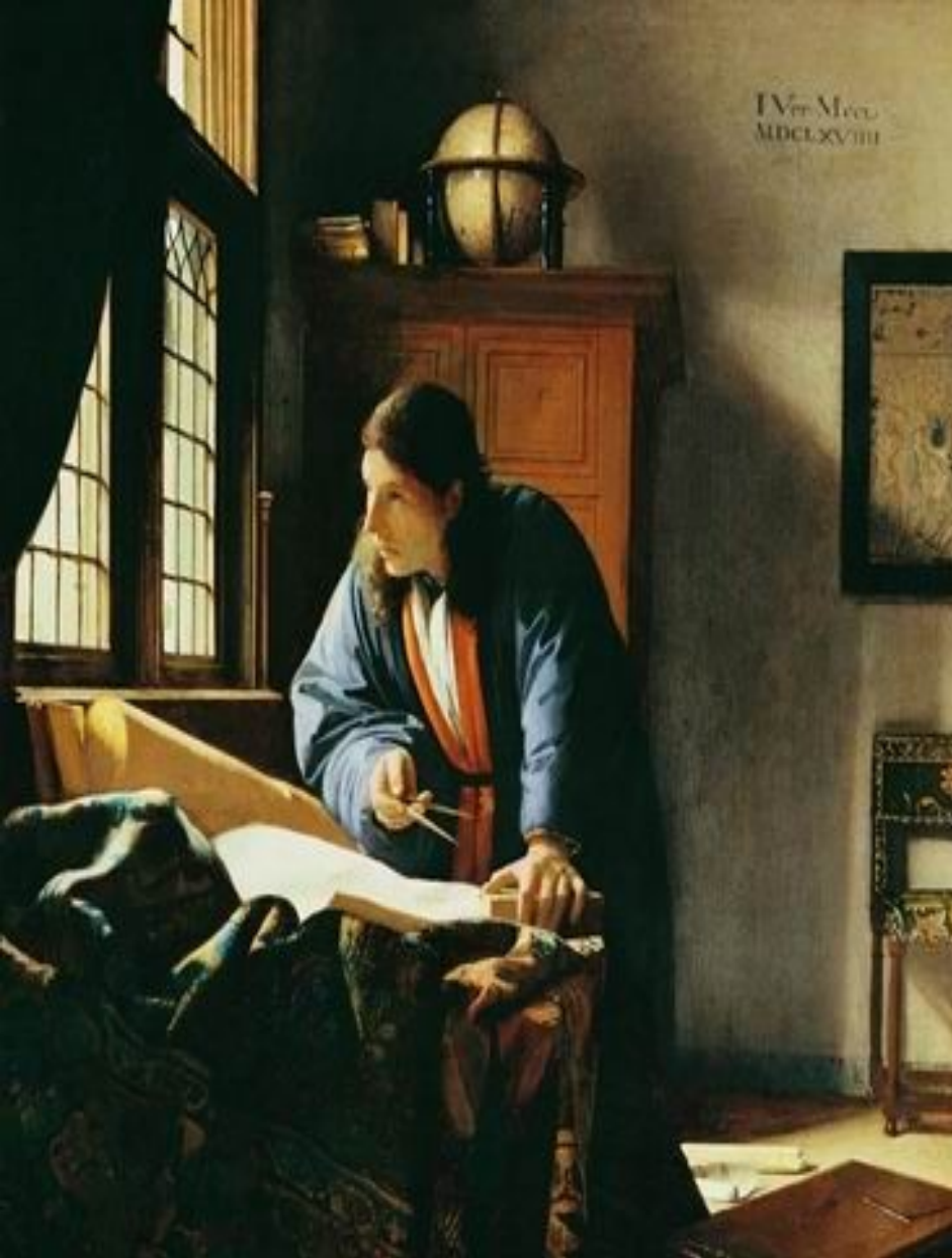
Географ. Ок. 1668—1669