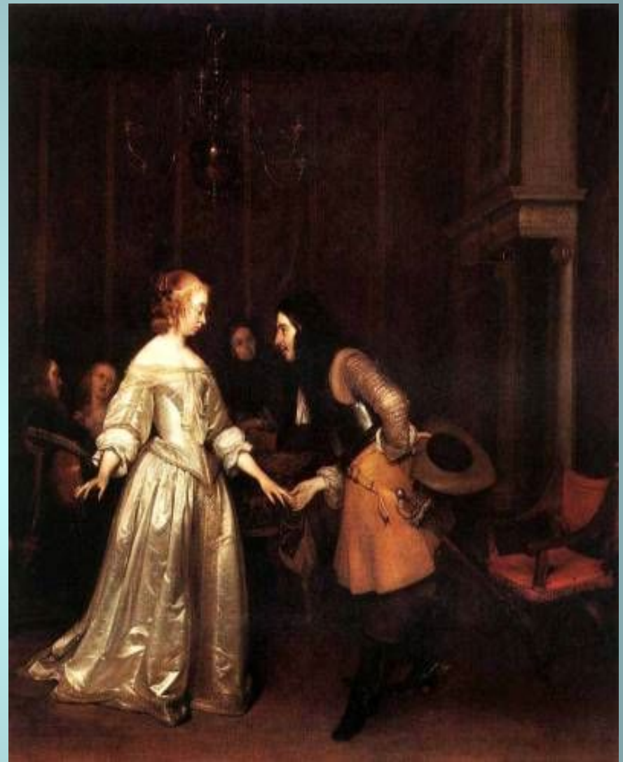
Танцующая пара. 1660г.Г. Терборх