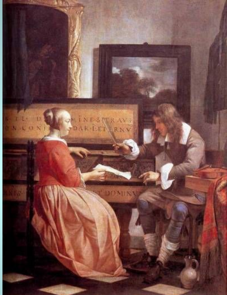
Сидящие мужчина и женщина. 1658-1660г.г.Г.Метсю.