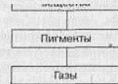
Рис. 5.1. Компоненты молока