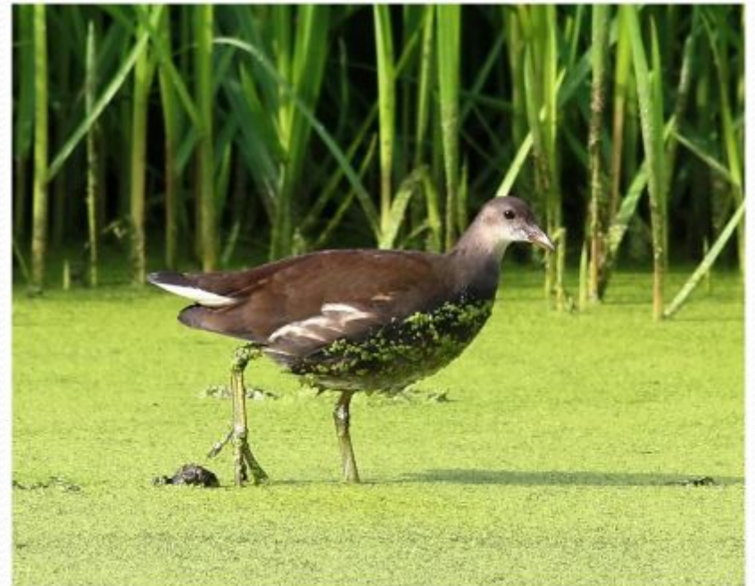
Лысуха или болотная курочка