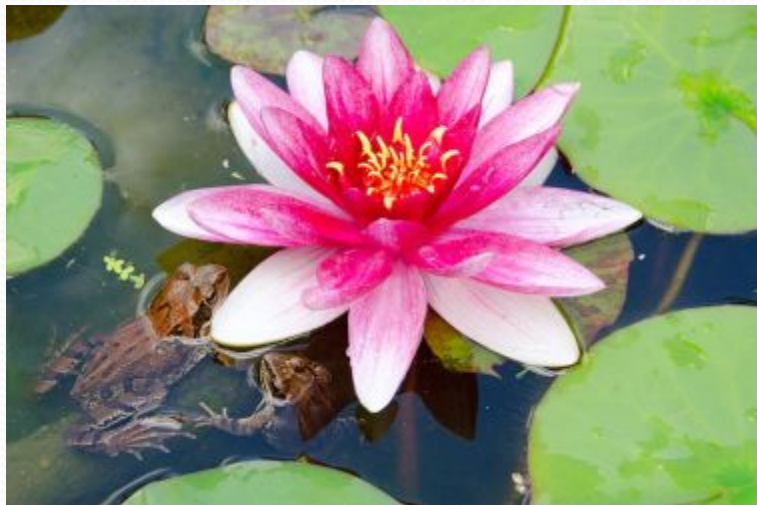
ЛИЛИИ (кувшинки) БОЛОТНЫЕ

В народной медицине ряску используют как жаропонижающее, противоаллергическое, общеукрепляющее, вяжущее, противовоспалительное, желчегонное, мочегонное и антимикробное средство.