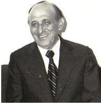
Тодор Живков, генеральный секретарь ЦК БКП (1954—1989)

В августе 1943 года царь Борис III скоропостижно скончался после встречи с Гитлером (возникли слухи о его отравлении). После смерти царя на престол вступил его шестилетний сын Симеон II . Фактически государством стали управлять его регенты . Правление юного царя было недолгим - ему пришлось вместе с семьей бежать в Египет , а потом в Испанию , так как после референдума 15 сентября 1946 была провозглашена Народная Республика Болгария . Республика развивалась по социалистическому пути вплоть до конца 1989 года , когда страна вышла из-под влияния СССР .