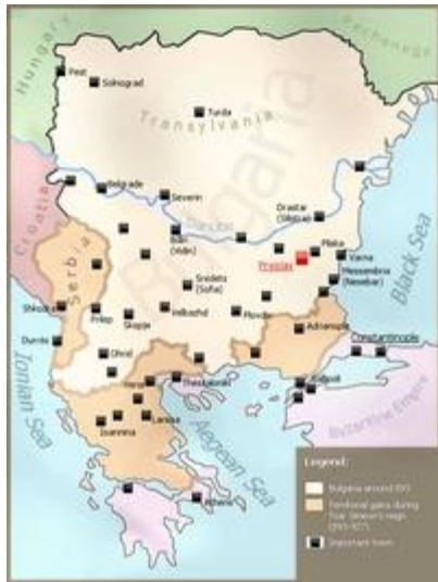
Первое Болгарское Царство при Симеоне

После смерти Кубрата государство распалось и сыновья хана, каждый со своим племенем откочевали в разные направления [1] . Один из сыновей Кубрата — Аспарух , со своим племенем занял земли за рекой Днестр на северо-западном побережье Чёрного моря. Там он вошёл в союзные отношения с местными славянскими племенами и в 681 году основал Болгарское государство, так называемое Первое Болгарское царство [2] . Официальной точкой отсчета существования Первого Болгарского Царства является подписание договора болгар с Византией после военного поражения последней в устье Дуная, по которому Византия обязалась платить болгарам дань. Столицей государства стал город Плиска . В состав государства вошли протоболгары, славяне и небольшая часть местных фракийцев . Впоследствии эти этносы образовали народ славянских болгар , получивших название по стране и говоривших на языке, от которого произошёл современный болгарский. В начале IX века территория государства существенно расширилась за счёт завоёванного Аварского каганата .