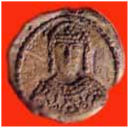
Печать царя Симеона