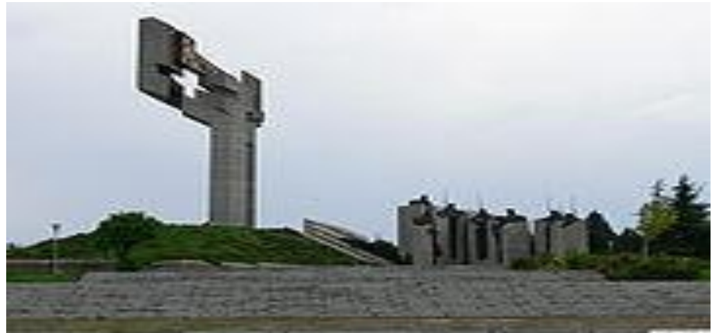
Памятник защитникам Стара-Загоры

В конце XIV века Болгария была завоёвана Османской империей . Сначала она находилась в вассальной зависимости, а в 1396 году султан Баязид I аннексировал её после победы над крестоносцами в битве при Никополе . Результатом пятисотлетнего турецкого правления было полное разорение страны, уничтожение городов, в частности, крепостей, и уменьшение населения. Уже в XV веке все болгарские органы власти уровнем выше коммунального (сёл и городов) были распущены. Болгарская церковь потеряла самостоятельность и была подчинена константинопольскому патриарху.