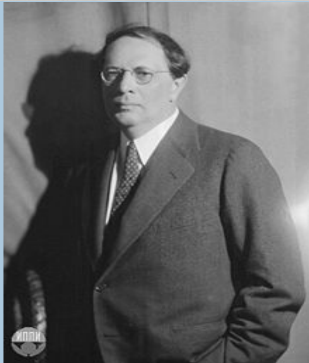
Алексей Николаевич Толстой