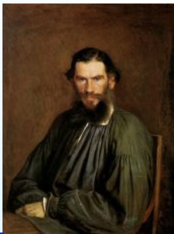
4 Толстой Л.

Напиши фамилии писателей в алфавитном порядке.