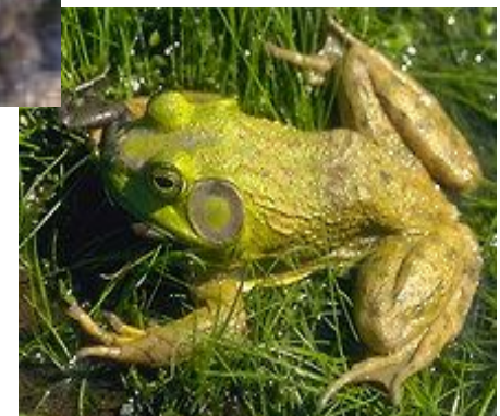
Лягушка - бык