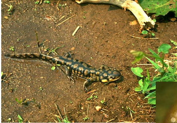
Восточная тигровая саламандра