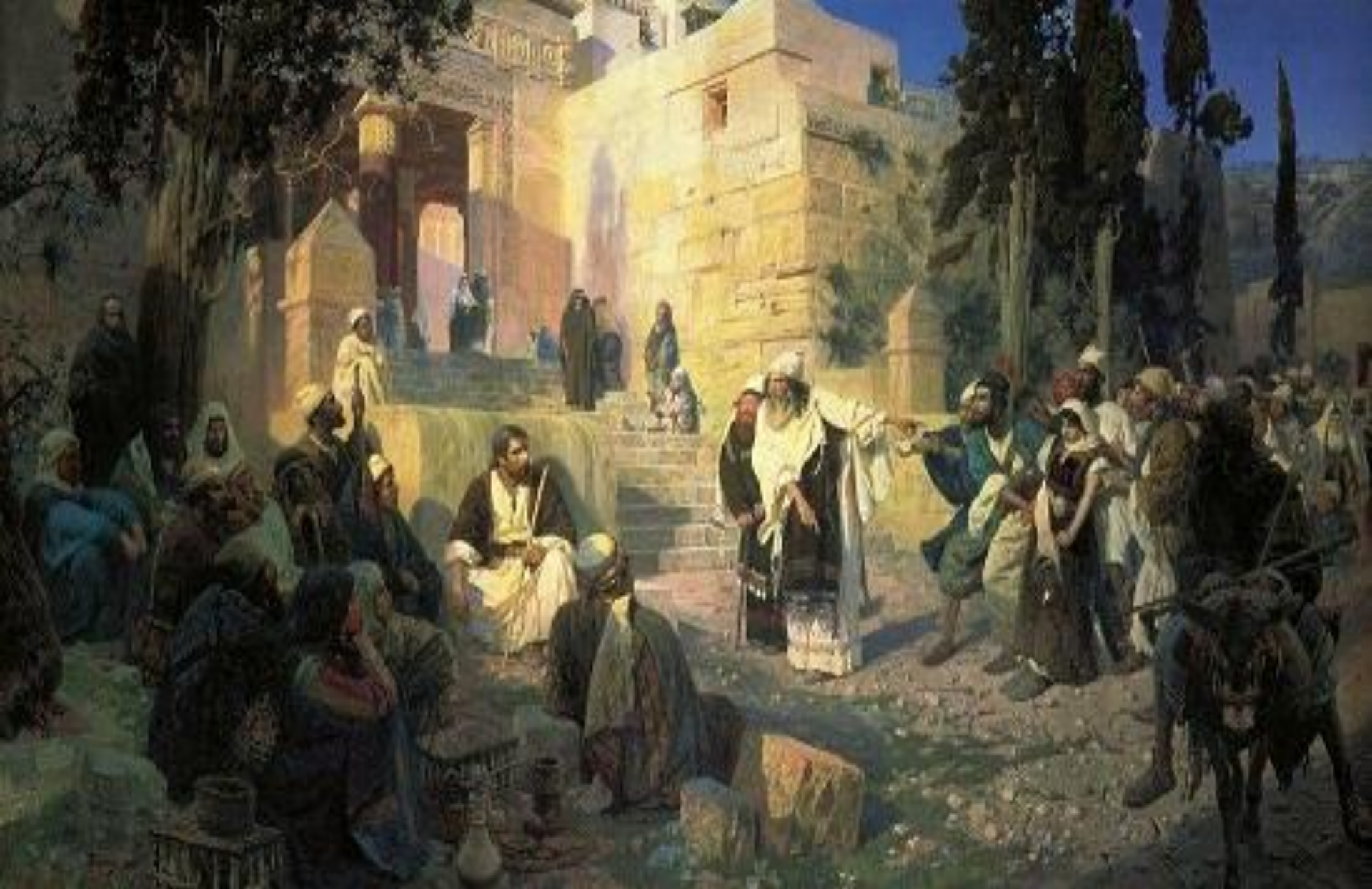
Василий Polenov «Христос и грешница»