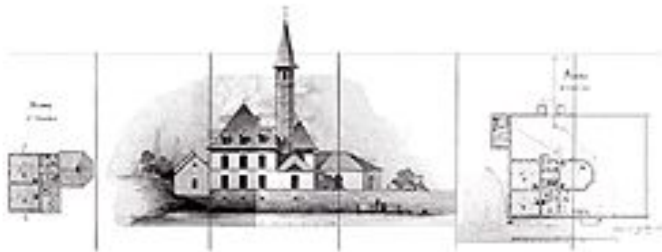
Дмитриев Н.В. Чертежи дворца