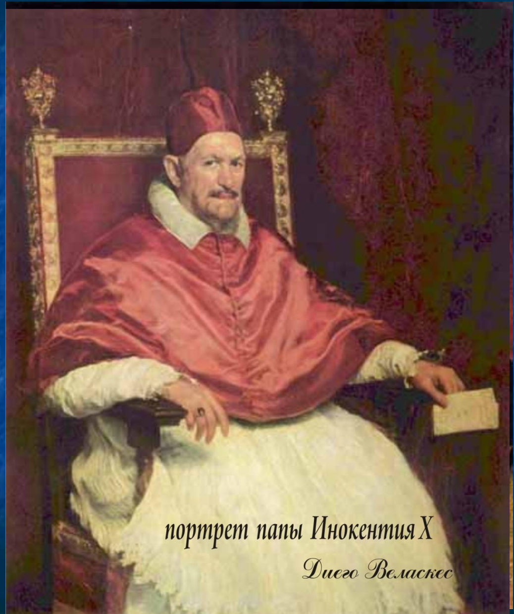
портрет папы Иннокентия X