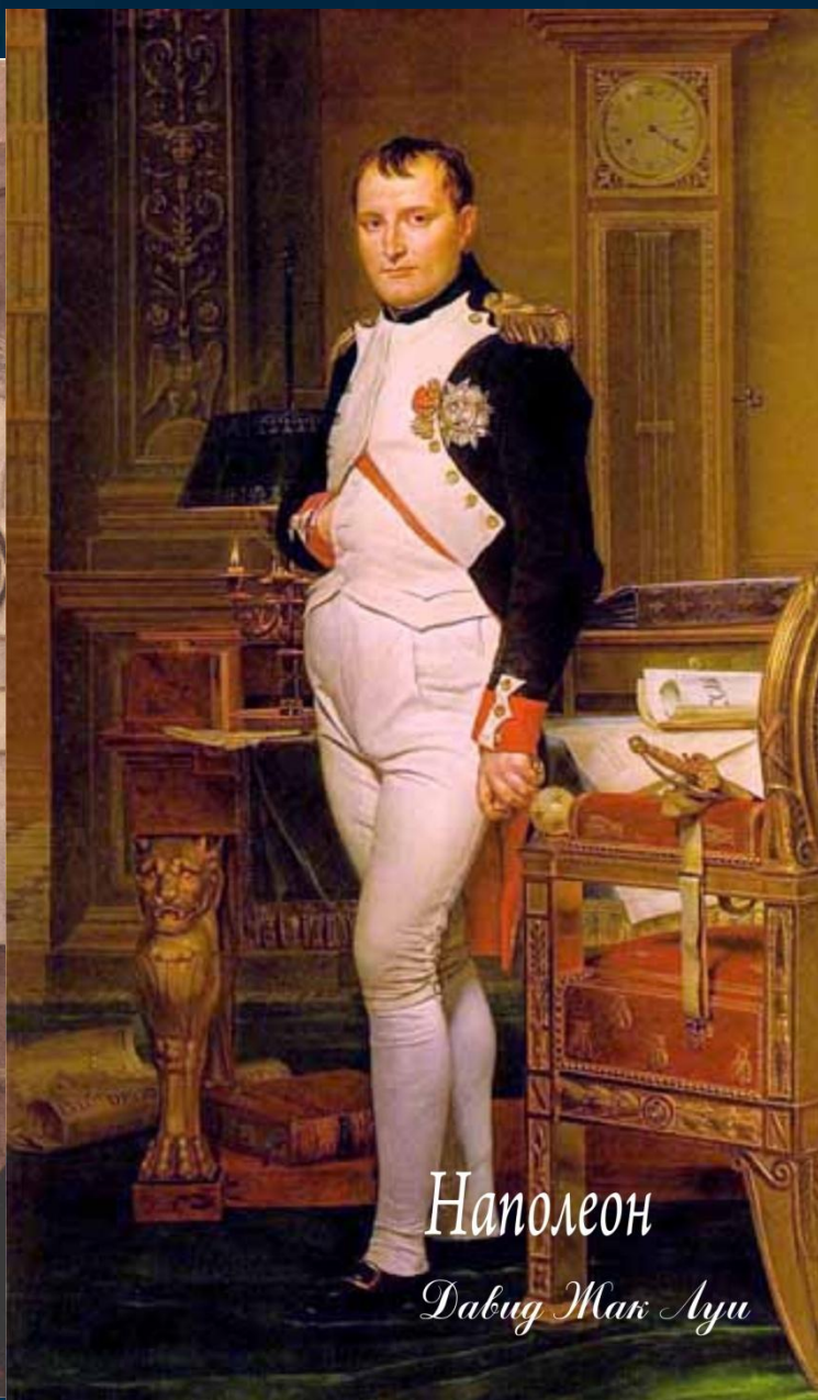
Наполеон Давид Жак Луи