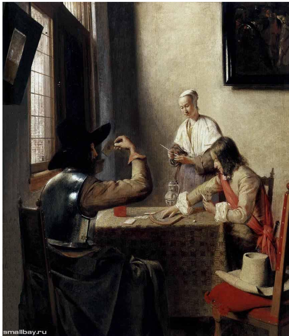
Солдаты, играющие в карты. 1658.