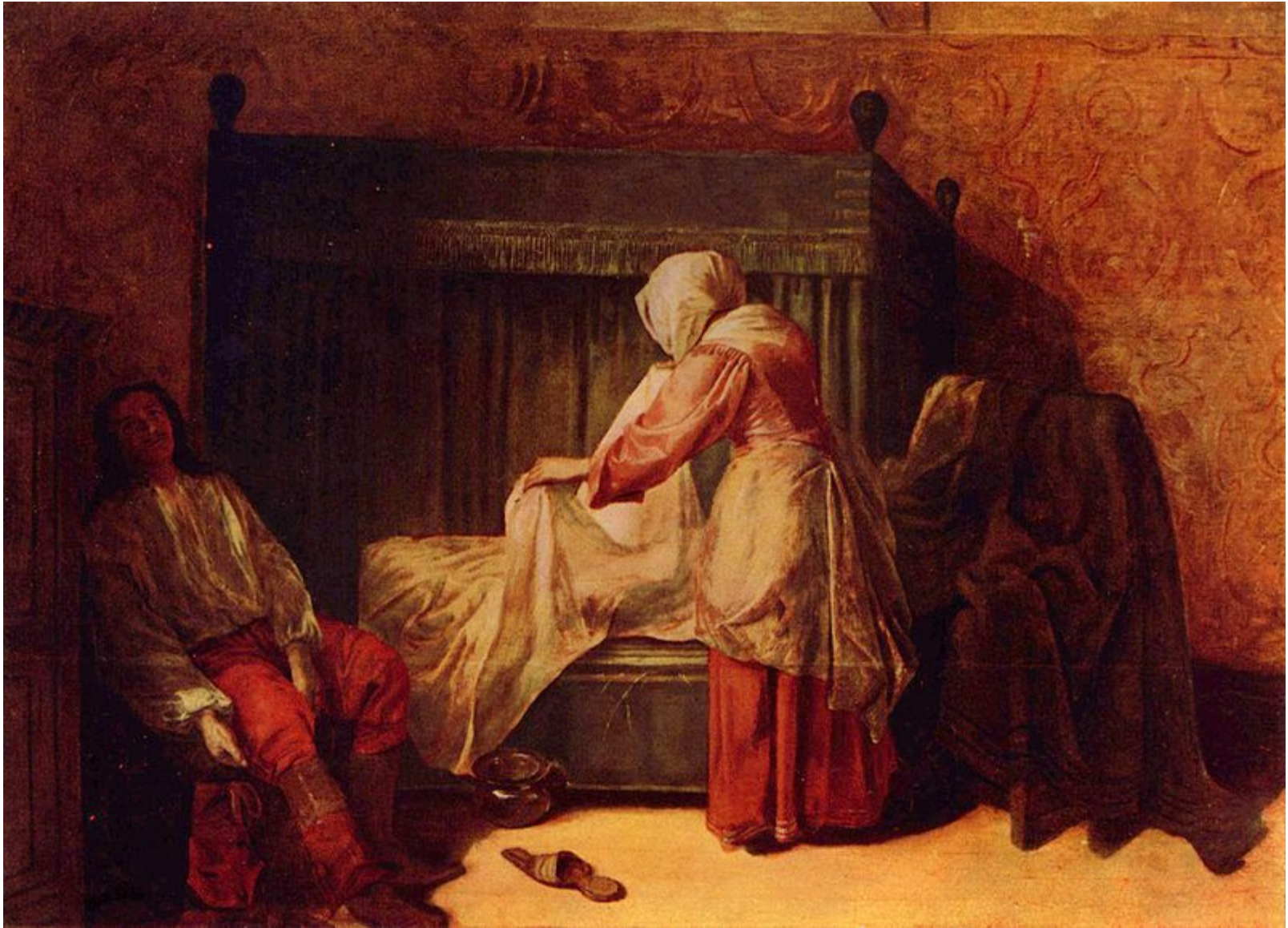
Утро молодого человека. 1655-1657.