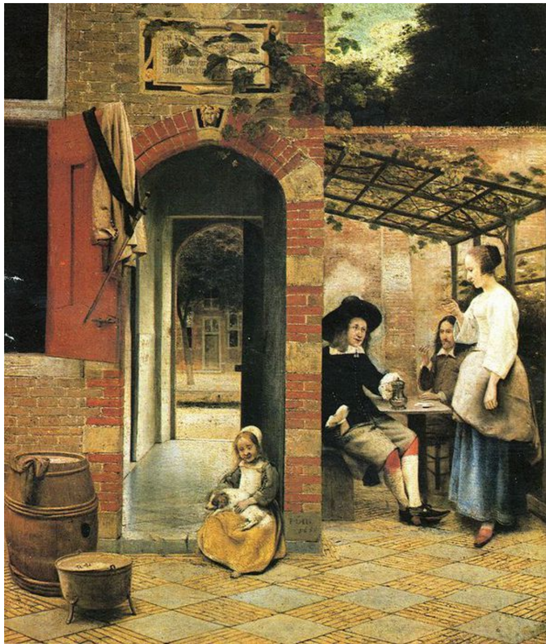
Два пьющих вино мужчины и женщина в беседке. 1658.