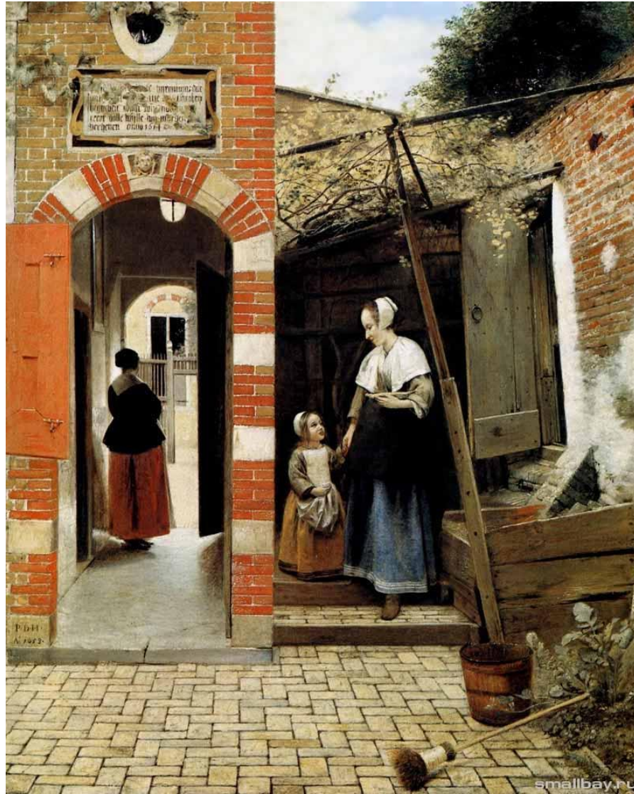
Западный дворик. 1568