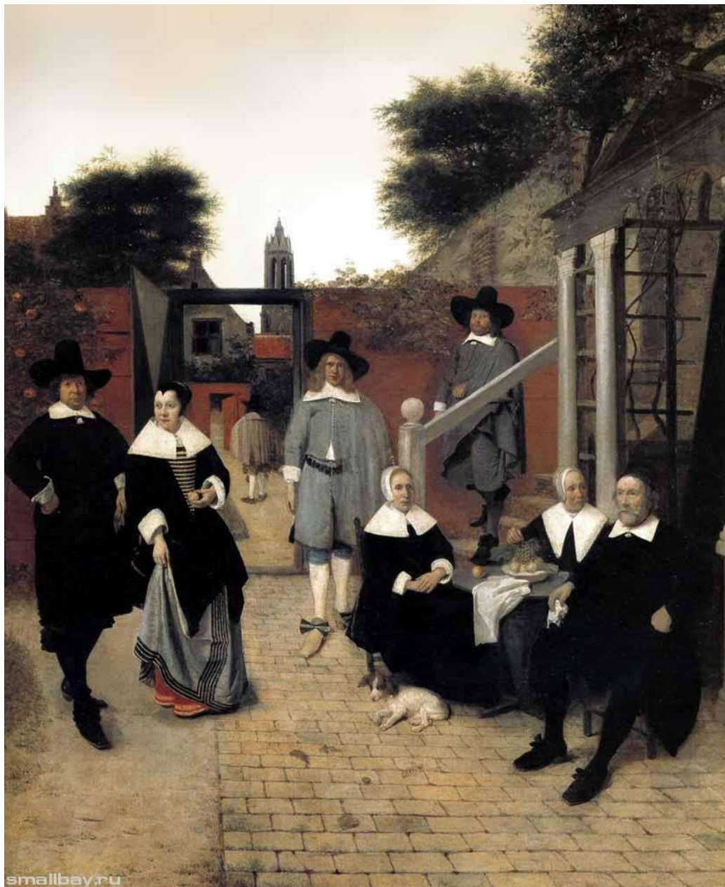
Голландская семья. 1662