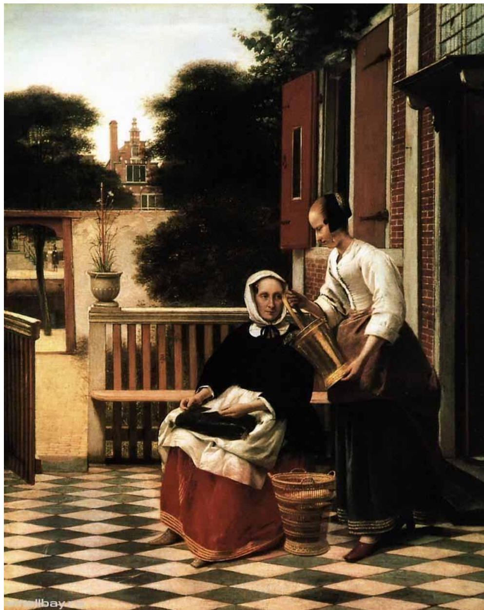
Хозяйка и её служанка.