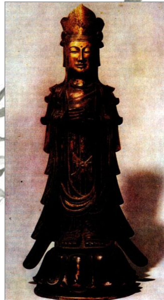
Статуя Канноп-босацу. VII в. Монастырь Хорюдзи близ Нары.

Статуи монахов из Нары мы справедливо причисляем к шедеврам искусства, хотя создание их было вызвано не художественными, а экономическими причинами. В VIII веке японские скульпторы отказались от бронзы, которая была им не по карману, и эта вынужденная экономия привела к изобретению новых художественных приемов. На деревянную или гипсовую основу накладывался слой специального лака (из смолы дальневосточного дерева сумах). Затем поверхность лака декорировалась разными способами - вставками из перламутра, росписью красками, растворенными в масле, нанесением узоров золотой и серебряной пудрой и т. д., что придавало статуям удивительную красоту и изысканность.