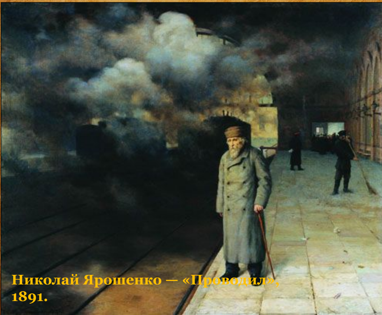
Николай Ярошенко — «Проводил», 1891.