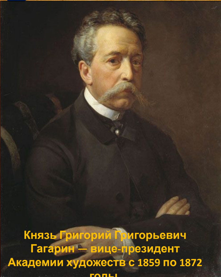
Князь Григорий Григорьевич Гагарин — вице-президент Академии художеств с 1859 по 1872 годы