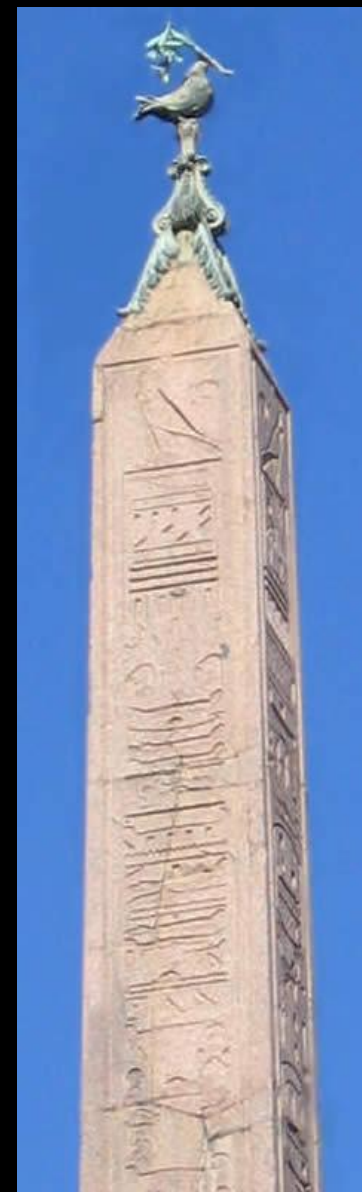
Фонтан Четырех Рек на площади Навона в Риме