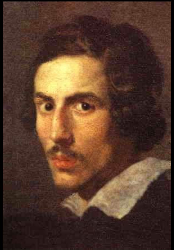
Бернини Лоренцо Джованни Автопортрет