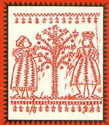
Русский народный свадебный обряд

Как по обрядам русичей начиналась семейная жизнь молодых? Сейчас мало кто помнит, что в мифах седой старины это торжество символизировало небесный брак Месяца и Солнца. Причем Месяц выступал в роли жениха, а Солнце - невесты. С другой стороны, в обрядах свадьбы отражена мысль о плодородии природы и продолжения рода. В память о солнечных культах невесты украшали свой наряд красными лентами. Кроме того, красный цвет считался цветом очистительной магии, хранил невесту от сглаза и колдовских чар. Обычай обмениваться обручальными кольцами тоже возник задолго до христианства. Кольцо - языческий знак Солнца. Древние римляне, германцы, славяне, индусы тоже обменивались кольцами на свадебных церемониях.