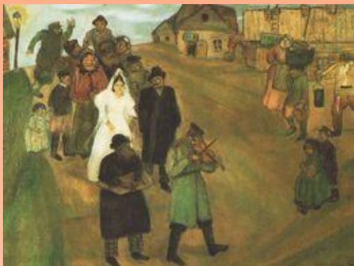
Жених и невеста, Орловская губ., Брянский у., 1908