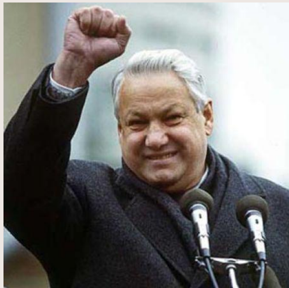
Ельцин Борис Николаевич (1991 – 2000)