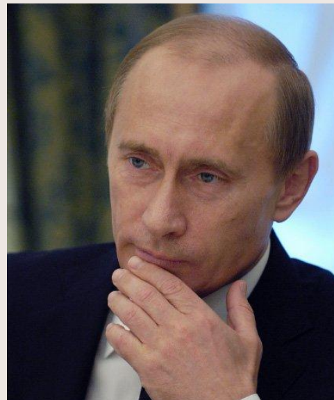
Путин Владимир Владимирович (2000 – 2008)