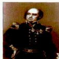
Дж. Франклин (1786–1847), английский полярный исследователь. Руководил полярными экспедициями, открывшими арктическую часть побережья Северной Америки