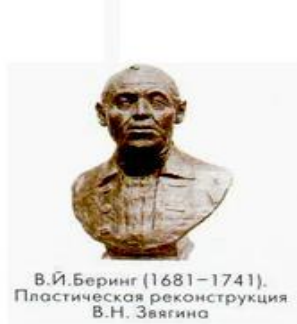
В.И. Беринг (1681–1741). Пластическая реконструкция В.Н. Звягина