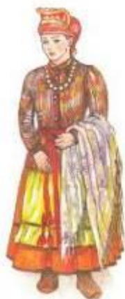
Женщина в праздничной одежде и павилуре