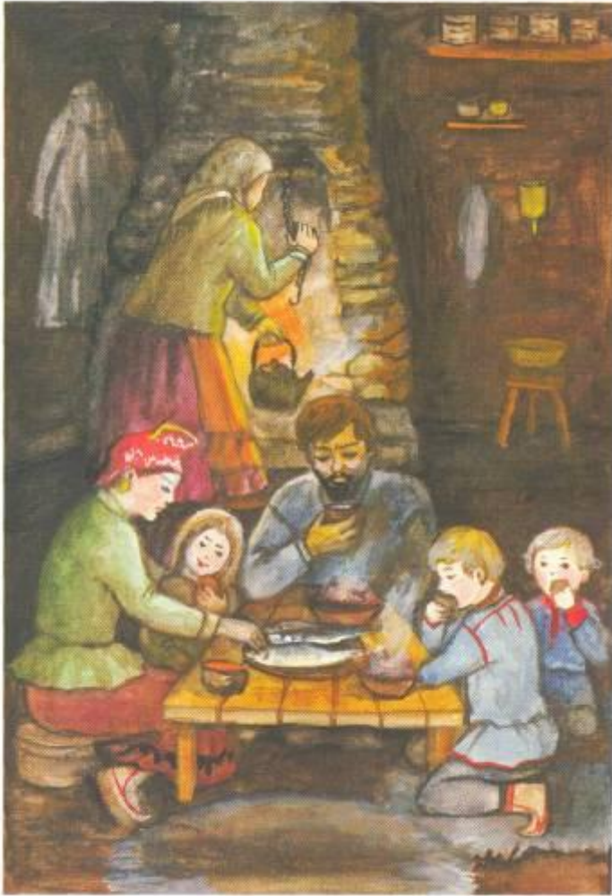
Обед в тупе