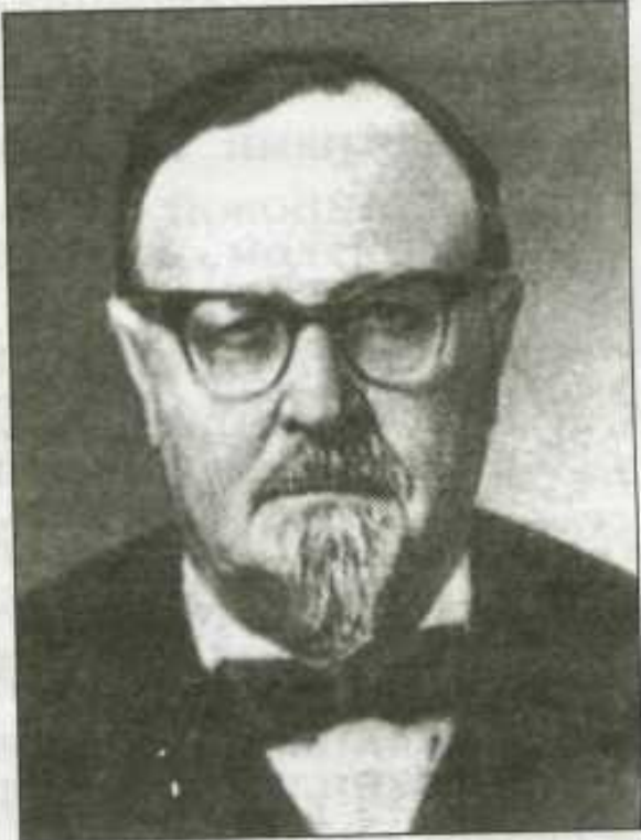
Александр Иванович Опарин (1894–1980)

Второе условие, при котором жизнь может возникнуть, - отсутствие свободного кислорода в атмосфере.