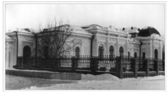
Исторический вид здания