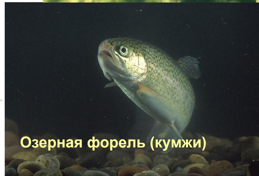
Озерная форель (кумжи)