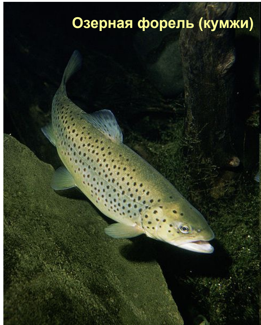
Озерная форель (кумжи)