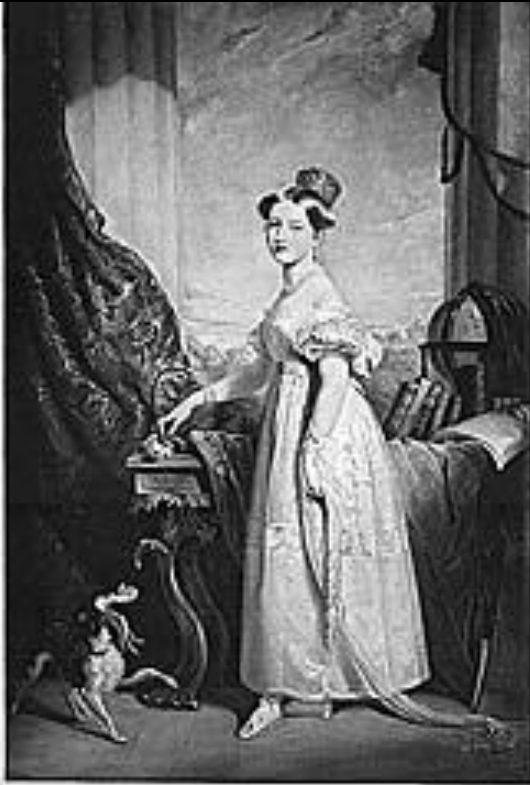
H. R. H. Princess Victoria 1833

From the picture after Sir S. Hayter at Windsor Castle