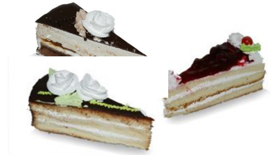
three pieces of cake