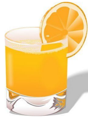
a glass of orange juice