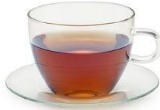
a cup of tea