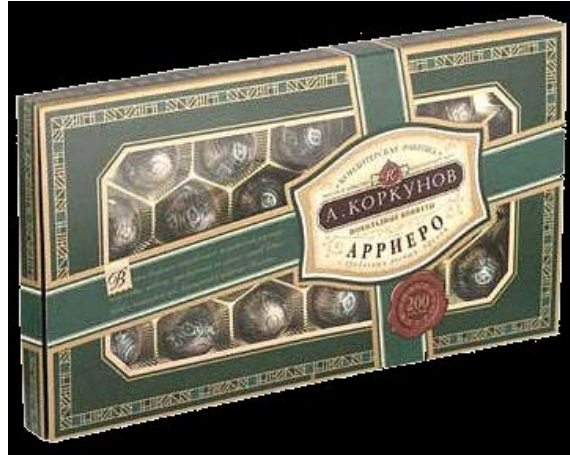
a box of chocolates