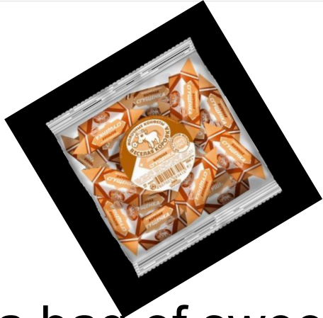
a bag of sweets