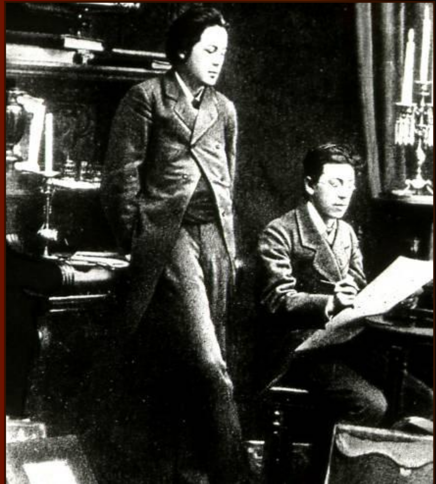
А.П. Чехов с братом Николаем