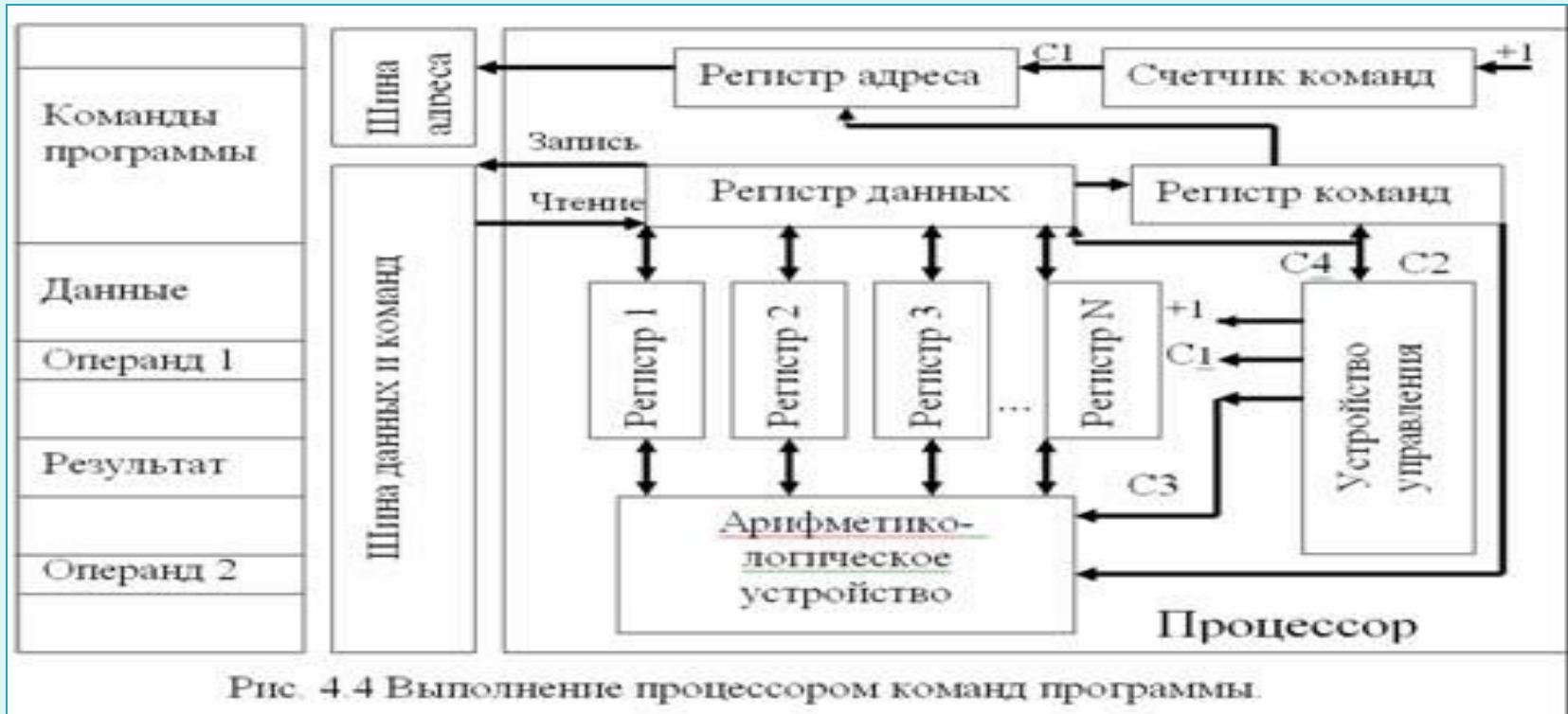
Рис. 4.4 Выполнение процессором команд программы.