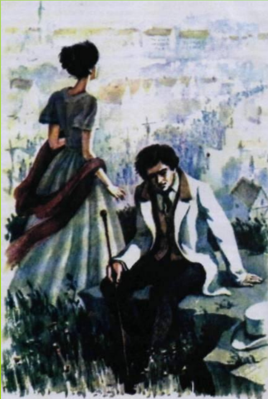
Иллюстрация В.М.Зельдес к повести И. С. Тургенева «Ася». 1982