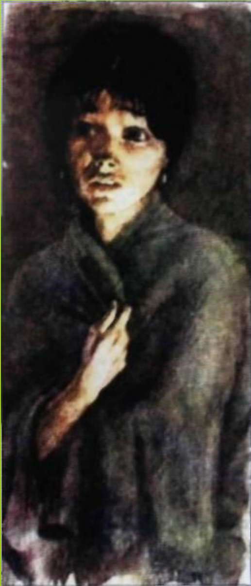
Иллюстрация В.М.Зельдес к повести И. С. Тургенева «Ася». 1982