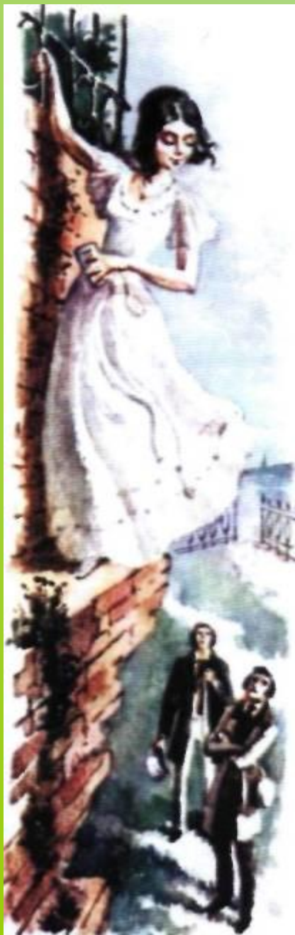
Иллюстрация В.М.Зельдес к повести И. С. Тургенева «Ася». 1982