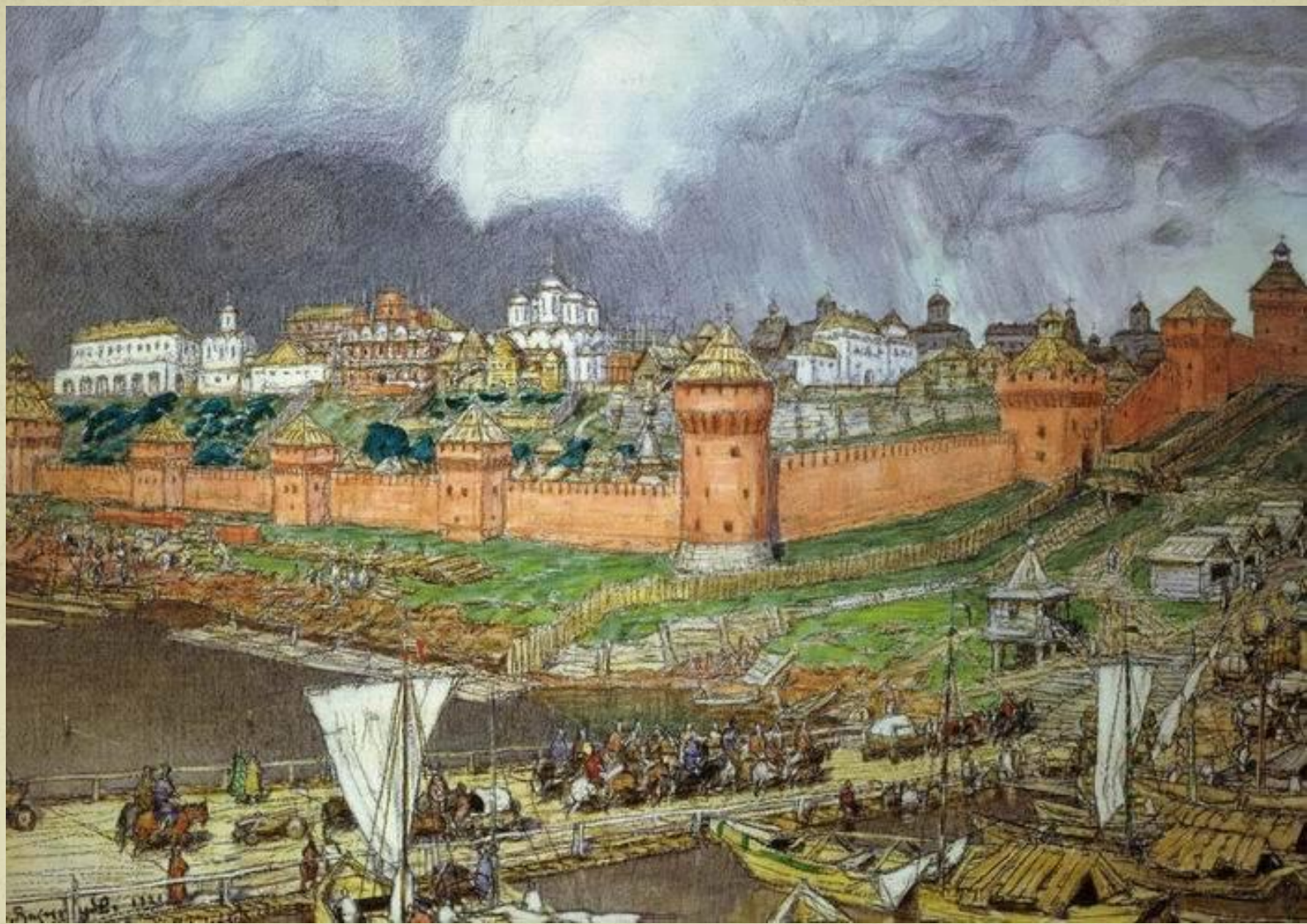
А.М.Васнецов. Кремль, XVI век.