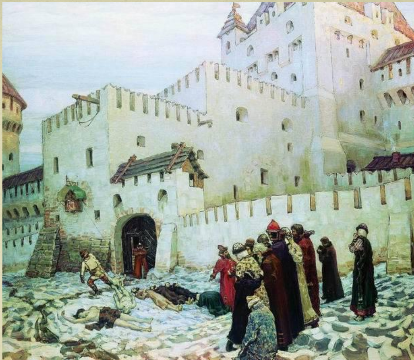
А.М.Васнецов. «Константино-Еленинские Ворота. XVI век.»