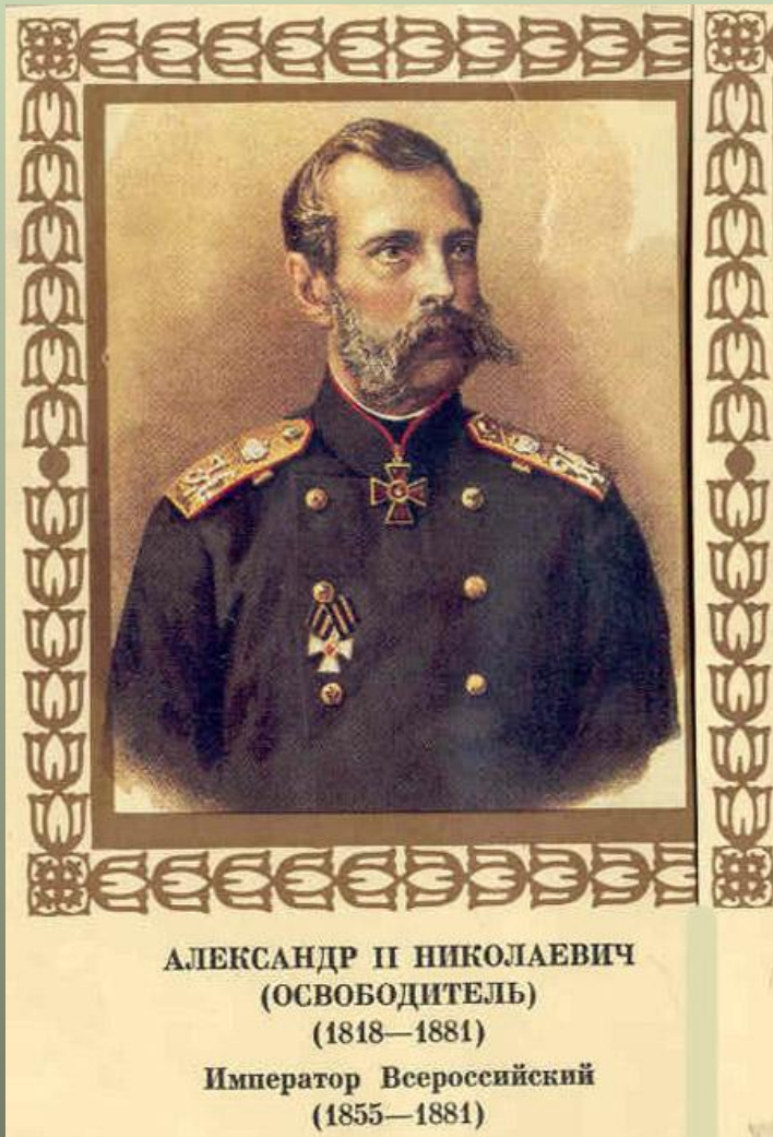
АЛЕКСАНДР II НИКОЛАЕВИЧ (ОСВОБОДИТЕЛЬ) (1818—1881) Император Всероссийский (1855—1881)