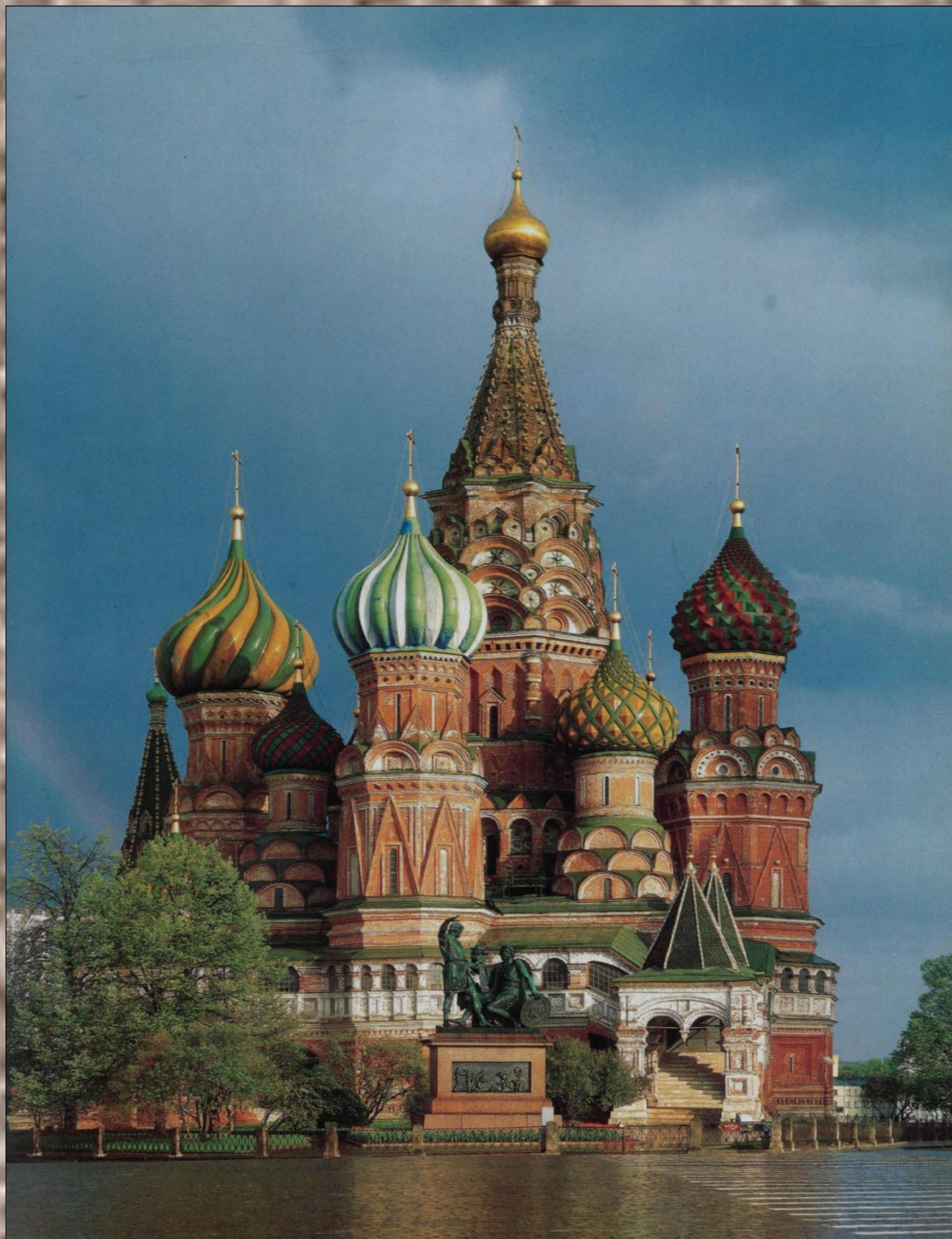
ХРАМ ВАСИЛИЯ БЛАЖННОГО