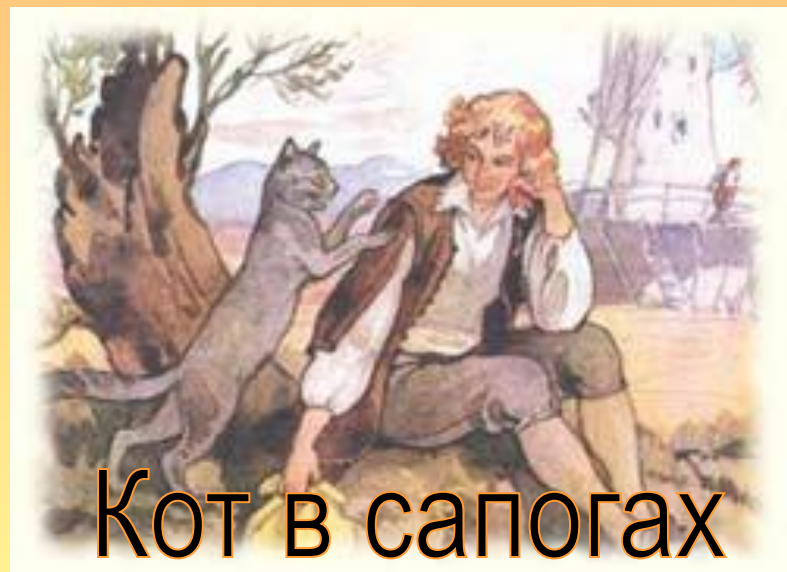
Кот в сапогах