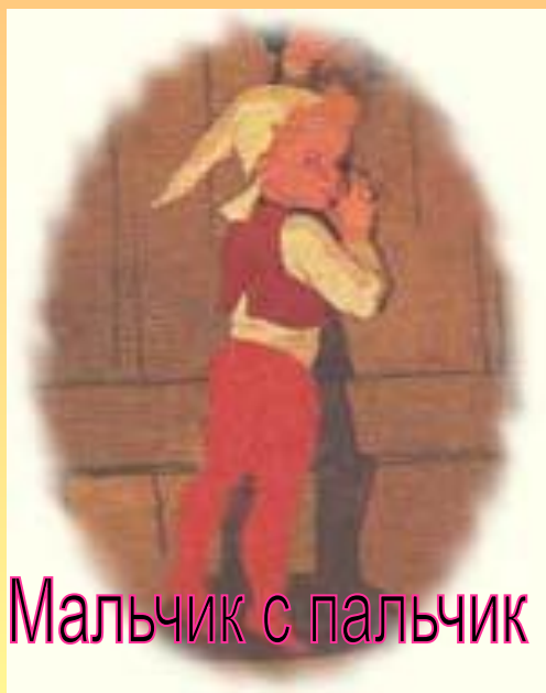
Мальчик с пальчик

На русском языке сказки Перро впервые вышли в Москве в 1768 году под названием "Сказки о волшебницах с нравоучениями", причем озаглавлены они были вот так: "Сказка о девочке с красненькой шапочкой", "Сказка о некотором человеке с синей бородой", "Сказка о батюшке котике в шпорах и сапогах", "Сказка о спящей в лесу красавице" и так далее. Потом появились новые переводы, выходили они в 1805 и 1825 годах. Скоро русские дети, также как и их сверстники в других странах, узнали о приключениях Мальчика с пальчик, Золушки и Кота в сапогах. И сейчас нет в нашей стране человека, который не слышал бы о Красной Шапочке или о Спящей красавице.