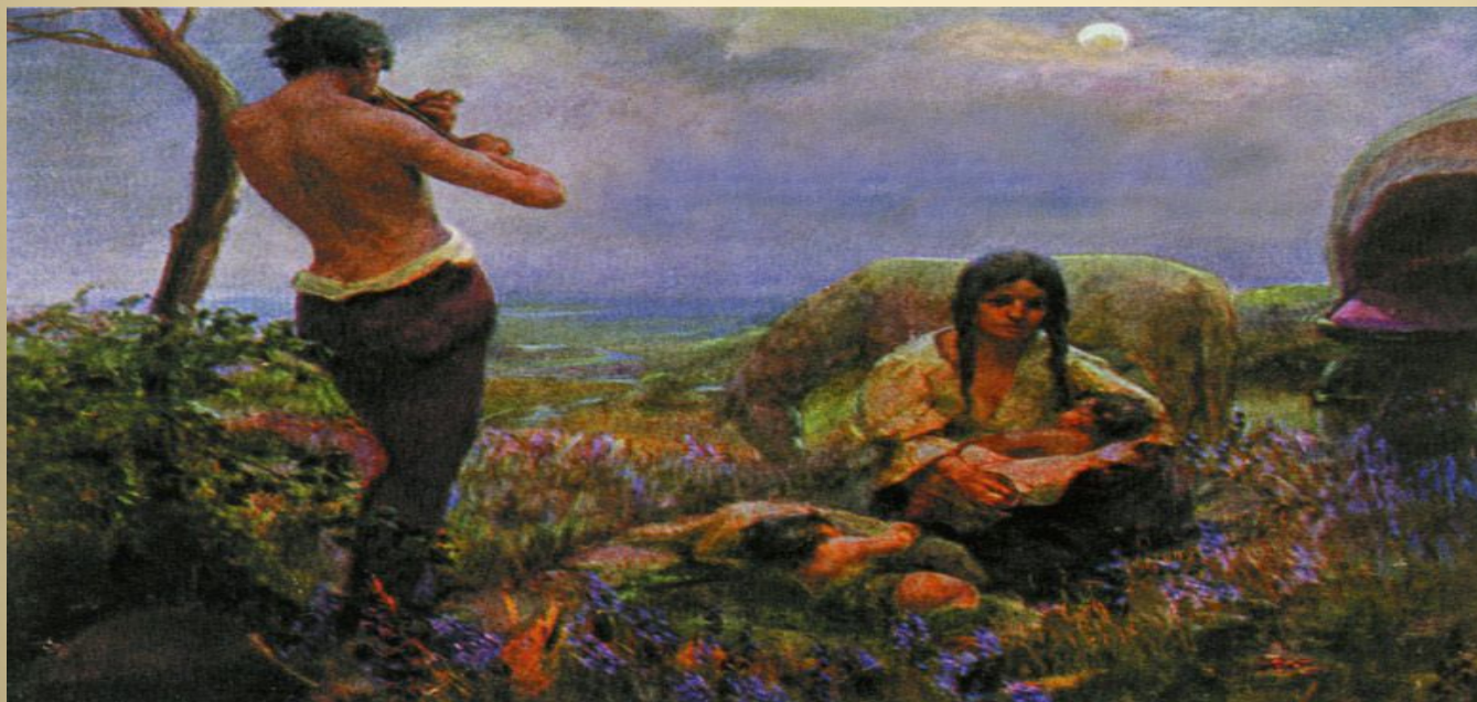
Неизвестный художник Около 1910 года.

Цыган из неизвестной семьи или утративший сведения о своей семье считается «безродным», вес в обществе его очень низок, к нему проявляют уважение только в пределах норм вежливости