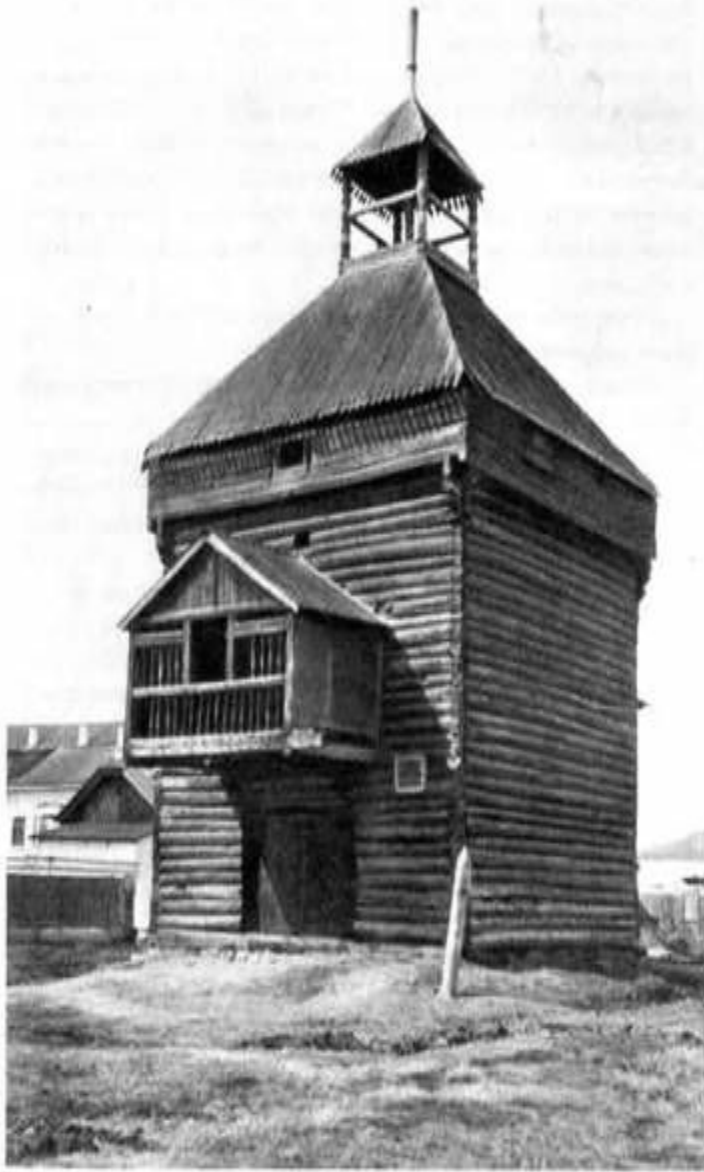
Башня крепости в городе Якутске.

Башни, превратившиеся по существу в полукруглые выступы стен, открытые со стороны города, стали называть бастеями, или ронделями (в России — персями). В русских Крепостях наряду с открытыми позициями в стенах устраивались специальные помещения с бойницами, называемые боями. Нижние (подошвенные) и средние бои имели по одному артиллерийскому орудю и назывались печурами, верхние бои предназначались для стрелков. В 16—17 вв. рондели были заменены постройками пятиугольной формы — бастионами (в России названы раскатами). С этого времени крепостные ограды бастионного начертания получили повсеместное распространение. В 18 в. стали разрабатывать и применять кремальерные, тенальные и капонирные (полигональные)