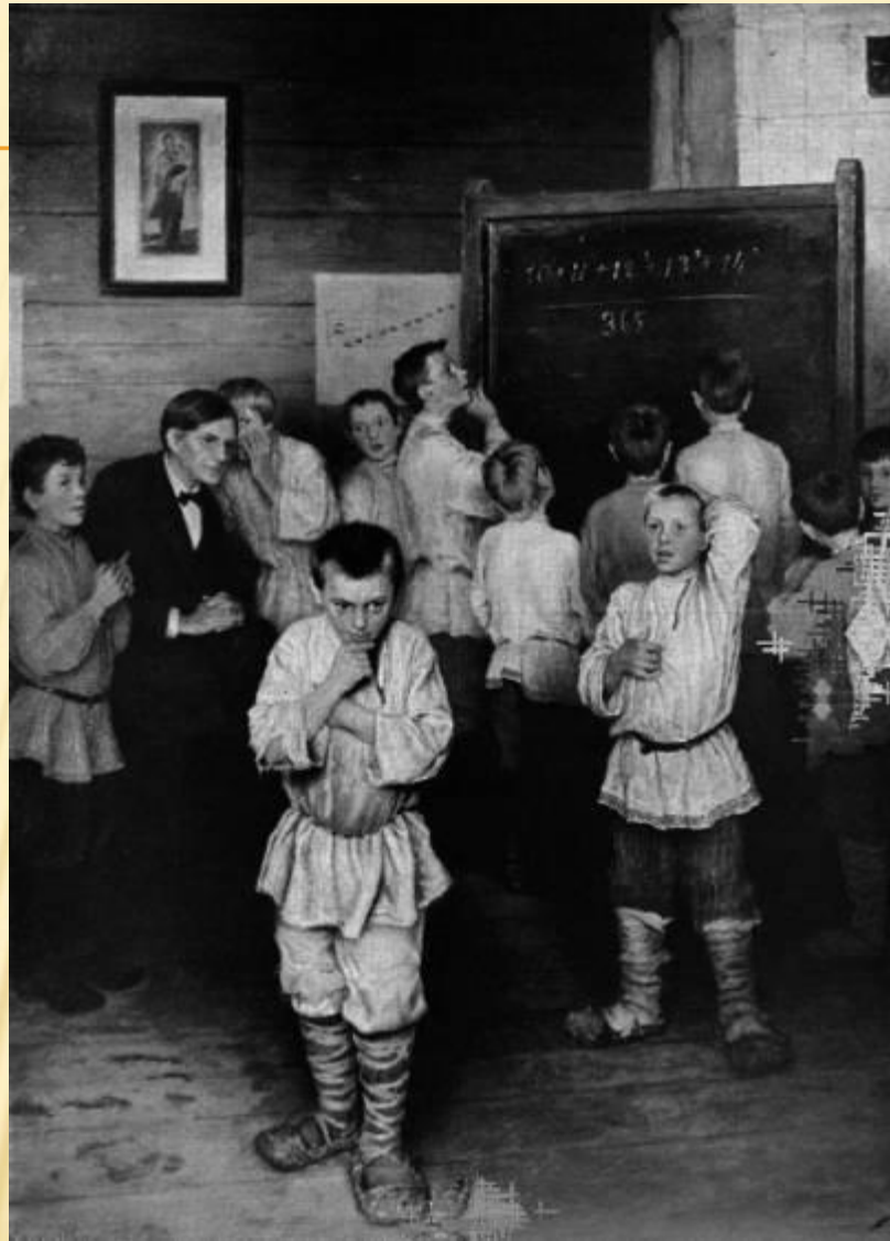
Н.Г. Богданов-Белинский «Устный счёт»