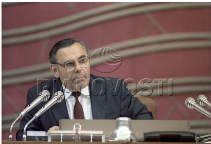
Иван Кузьмич Полозков

Решающее голосование состоялось 29 мая 1990 г.