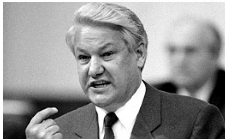
Борис Николаевич Ельцин

Перевесом всего в 4 голоса победу одержал Ельцин . Он стал Председателем Верховного Совета РСФСР