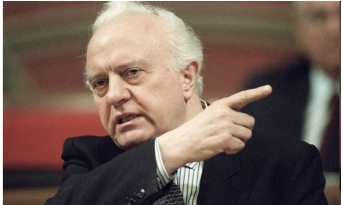
Эдуард Амвросиевич Шеварднадзе – министр иностранных дел СССР (1985-1990)

Последовало значительное обновление руководства МИДа