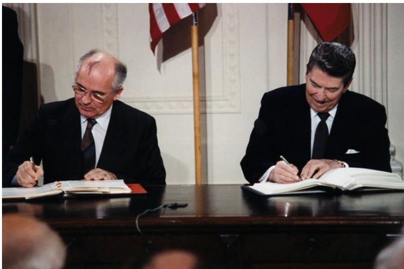
М. Горбачев и Р. Рейган подписывают Договор РСМД

Впервые от переговоров об ограничении вооружений две сверхдержавы перешли к ликвидации этого оружия