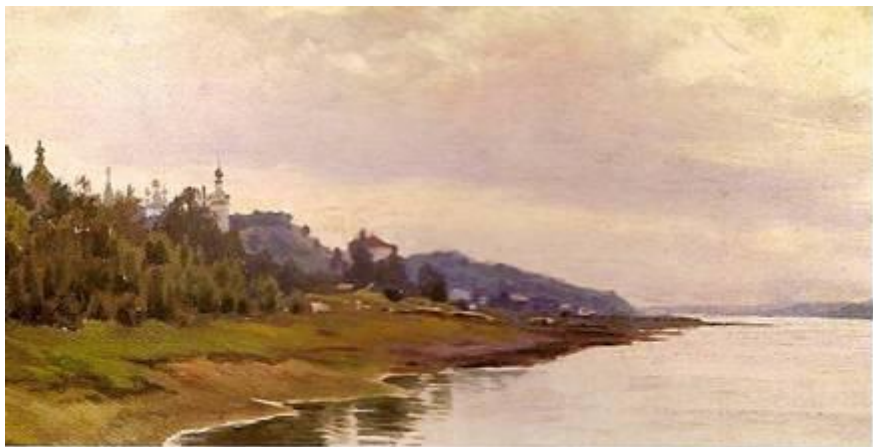
«Уголок в Плесе», этюд 1888 года «Волга. Баржи», 1890 – е годы