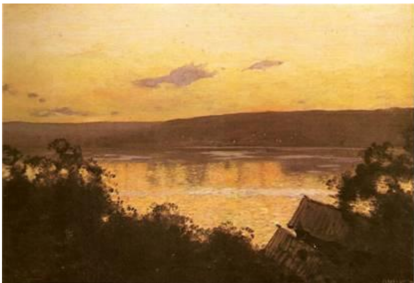
«Вечер на Волге», 1888 год «Вечер. Золотой Плес». Этюд