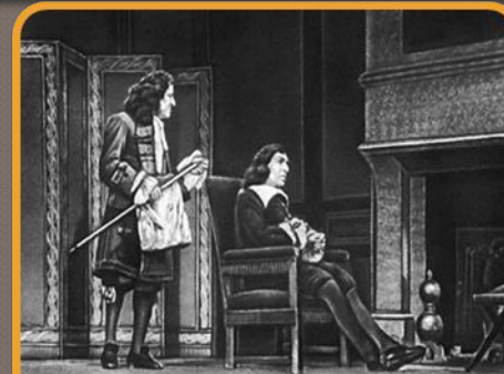
1666 - «Мизантроп»