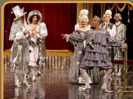
1670 - «Мещанин во дворянстве»