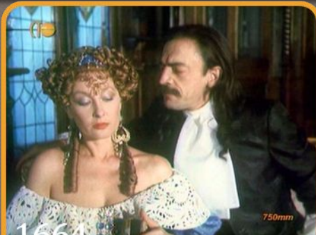
1664 - «Тартюф, или Обманщик»