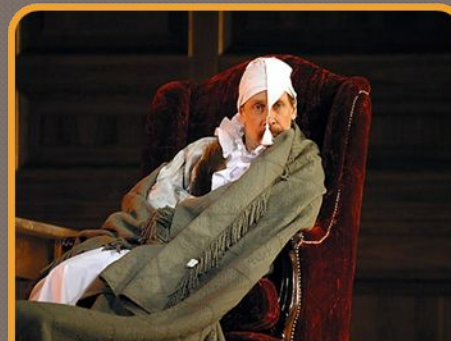
1673 - «Мнимый больной»