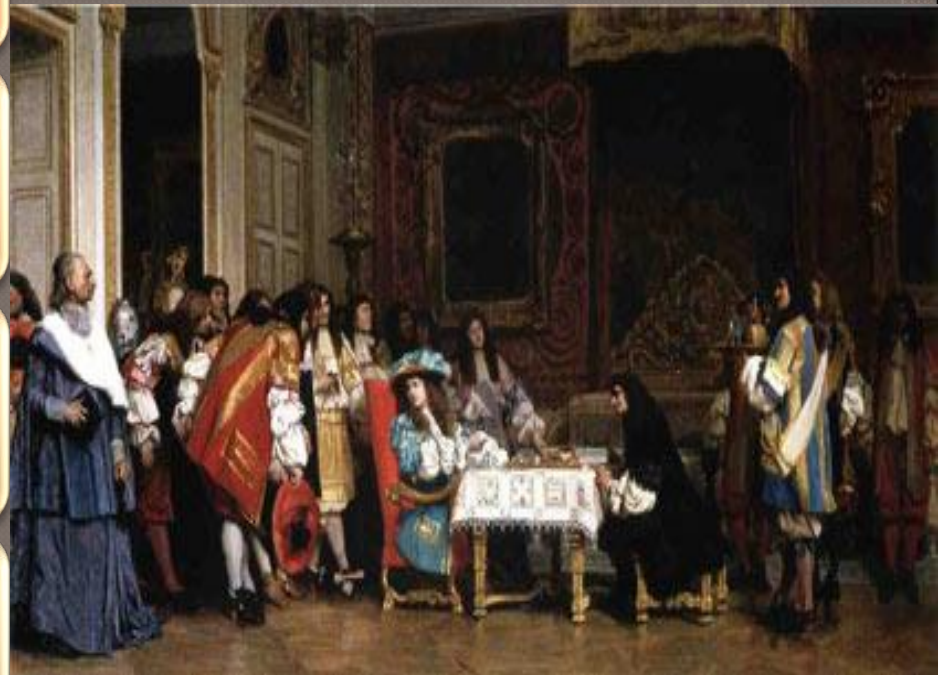
Louis XIV and Moliere by Jean Leon Gerome

За эти 15 лет [1658—1673] Мольер создал все свои лучшие пьесы.