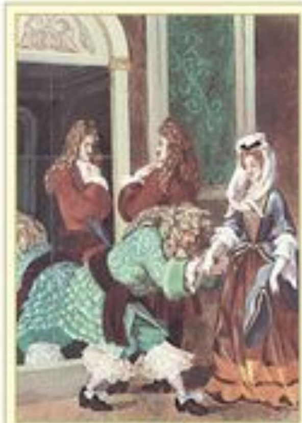
Иллюстрация к комедии Ж. Б. Мольера 'Мизантроп' из дворцовой Художник А. Аронов