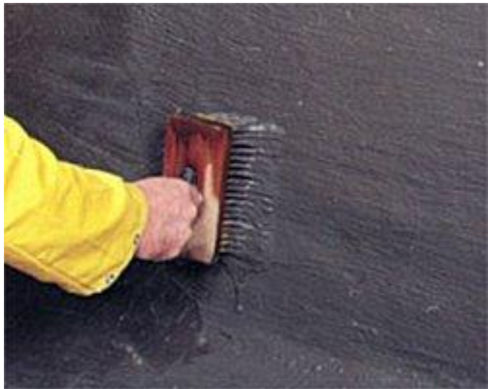
Обмазувальна гідроізоляція на мінеральній основі