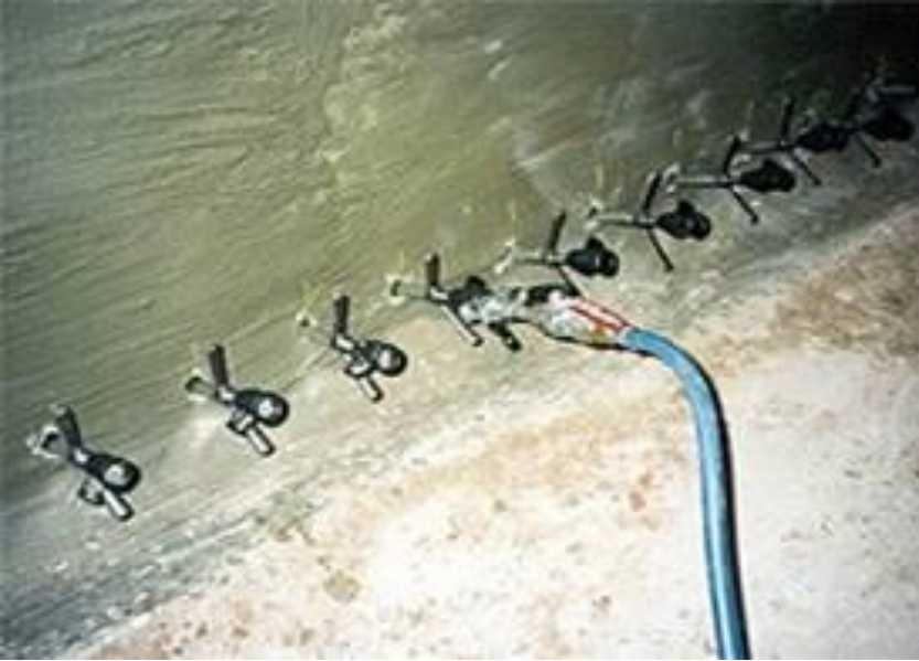
Відсічна горизонтальна гідроізоляція