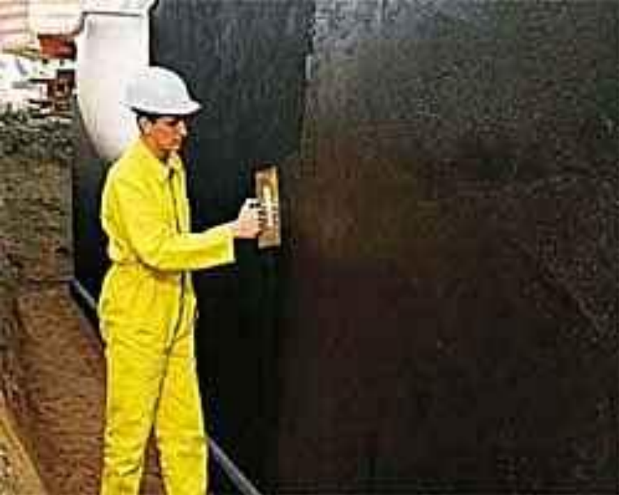
Обмазувальна гідроізоляція на бітумній основі