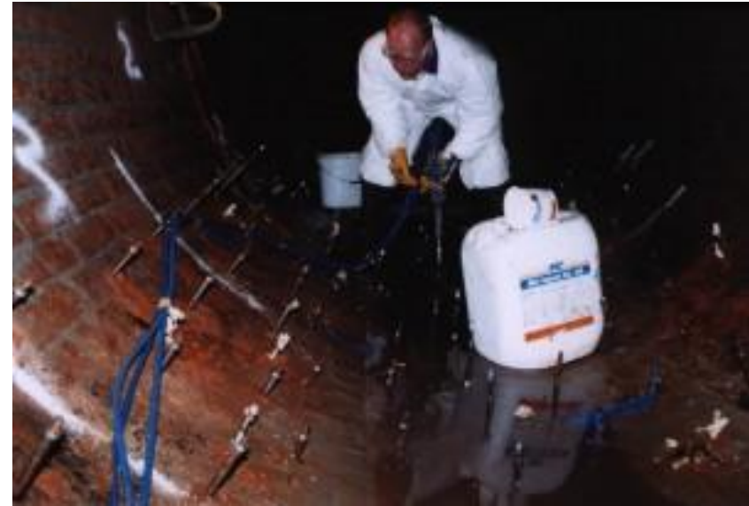
Загороджувальна ін'єкційна гідроізоляція