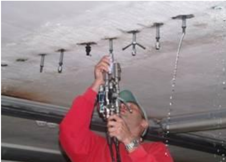
Ін'єктування тріщин та активних протікань