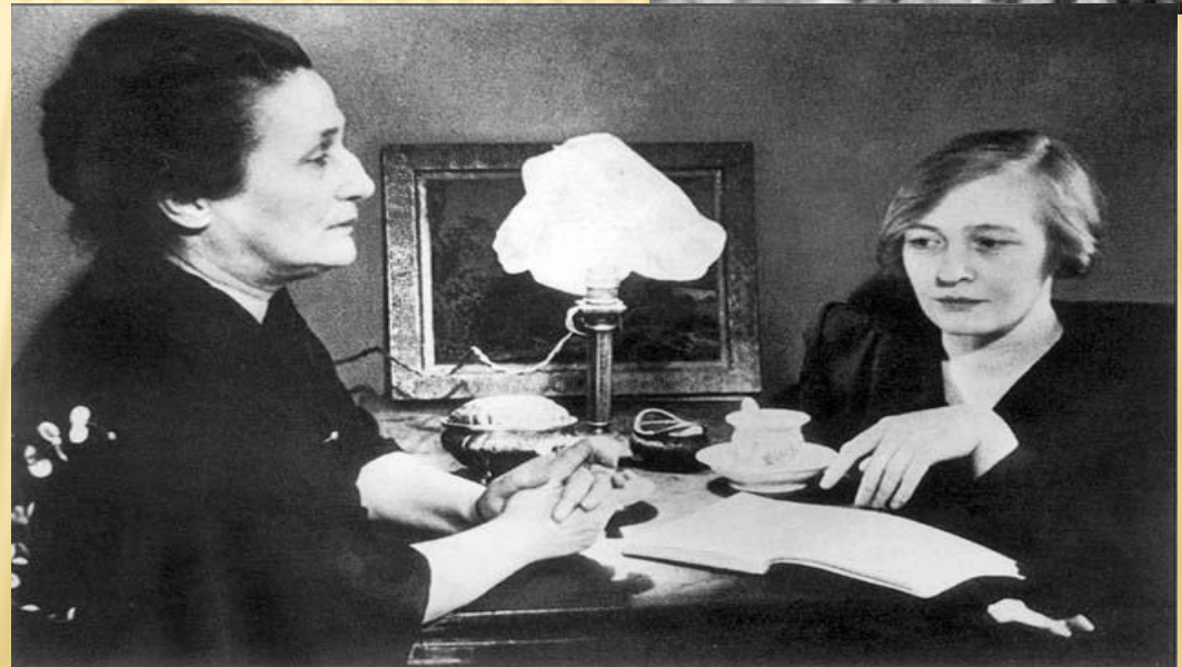
Ольга Берггольц и Анна Ахматова